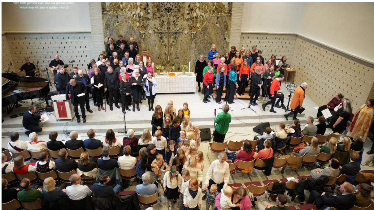
Vigslingsgudstjeneste i Sædalen kirke 3. november 2024