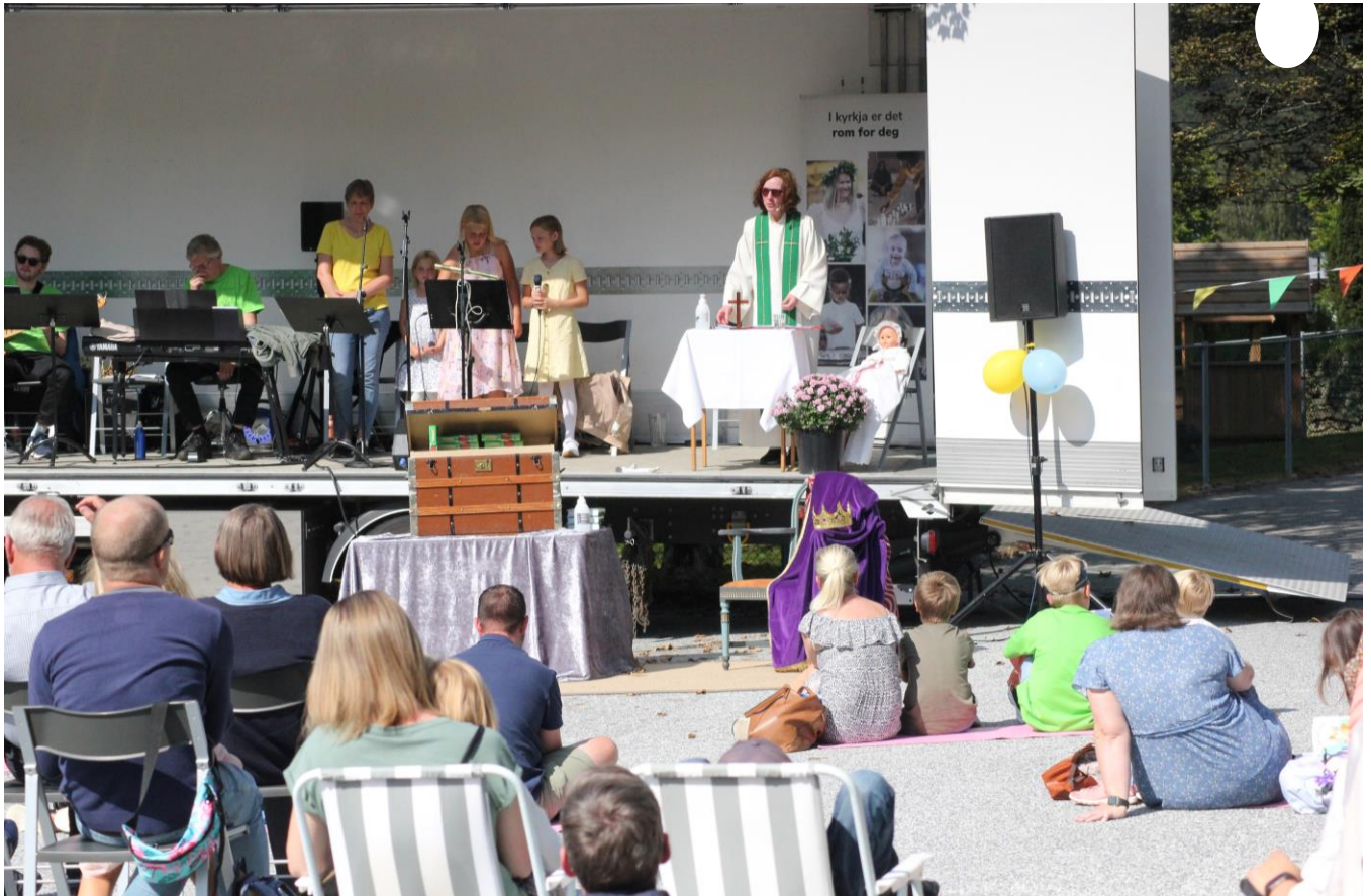
Frå ei av tre utegudstenester 22. august 2021.