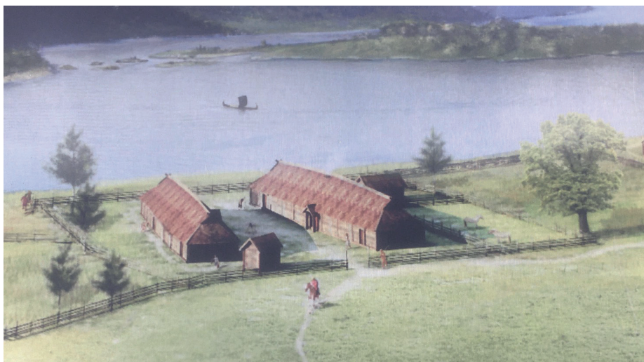
Arkikons illustrasjon av hvordan kongsgården på Alrekstad kan ha sett ut