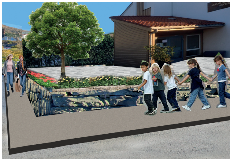
Slik kan det bli foran menighetssenteret etter nytt fortau er på plass. Digital illustrasjonsskisse.

Bergen kommune vil bedre trafikk-sikkerheten langs Jonas Liesvei mellom Kronstad skole og Pasienthotellet. Det blir fortau med 2,5m bredde foran menighetssenteret. Årstad menighet avstår grunn slik at hekken blir tatt vekk og ny mur nærmere menighetssenteret blir satt opp. Menighetsrådet har også tatt initiativ til at hekken ned fra plassen foran menighetssenteret må vekk, fordi den skygger for åpen sikt fra gangvei til biltrafikk på Jonas Liesvei. Menighetsrådet vil at bakken ned fra menighetssenteret derfor også må få 2,5m gangvei/fortau ut fra forskriften om universell utforming for rullestoler og gående. Bakken slik den er i dag er for trang og hekken skaper en trafikkfarlig situasjon. I det menighetsbladet går i trykken har Bymiljøetaten akseptert dette. God trafiksikkerhet er diakoni i praksis!