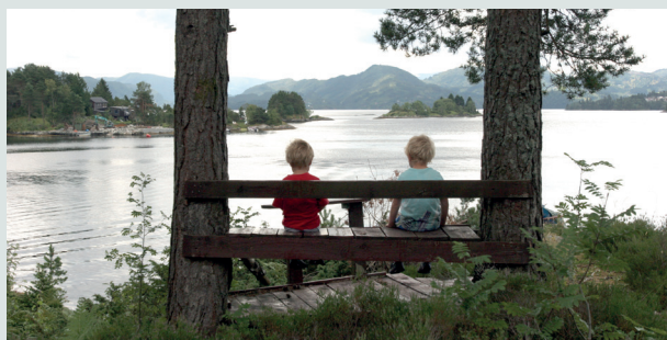
VÆR EN VENN!

Men på Frostatinget led han nederlag og han valgte å ikke å gå frem med tvang og fikk ikke arbeidet videre med omvendning i Trøndelag før han døde i 961 på Håkonshella. Men at Håkon bør få mye av æren for å ha innført kristendommen i Norge, bør det ikke være noen tvil om.