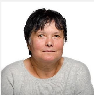
SØLVIDALSOTTEN Barnepleier Assistent