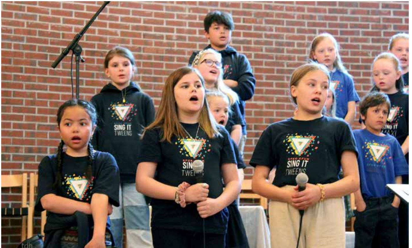
Sing It-koret bidro med vakker sang på gudstjenesten.

Tusen takk til alle frivillige som gjorde og fortsetter å gjøre en fantastisk innsats!