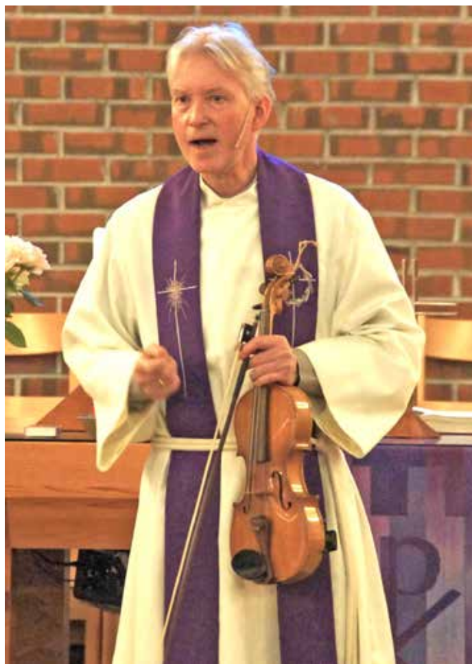
En fele-spillende sogneprest