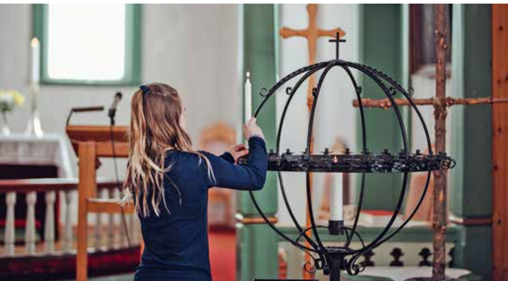
TENN ET LYS FOR FRED: Kirken oppfordrer til å markere solidaritet med dem som lider i Ukraina og dem som flykter fra krigens redsler.

Velsignet er Herren som gjør under! Han viste meg miskunn i en beleiret by. Jeg sa i min angst: «Jeg er støtt bort fra dine øyne.» Men du hørte min bønn da jeg ropte til deg. Elsk Herren, alle hans fromme! Herren verner de trofaste, men den hovmodige gir han igjen i fullt mål. Vær modige og sterke, alle dere som venter på Herren!