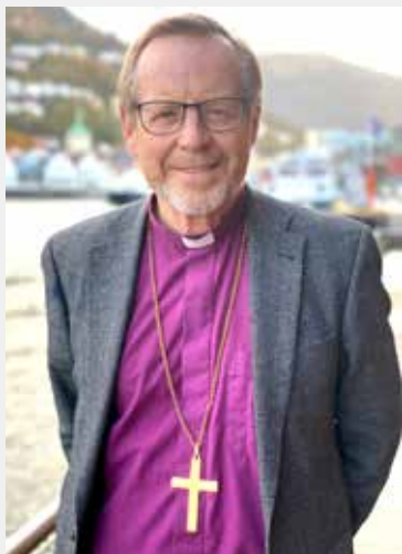
Halvor Nordhaug

Biskop Halvor Nordhaug går av med pensjon i desember 2022, og prosessen med å finne en ny biskop har startet. Nå inviterer bispedømmerådet alle som ønsker det til å foreslå hvem de mener kan passe som ny biskop i Bjørgvin.