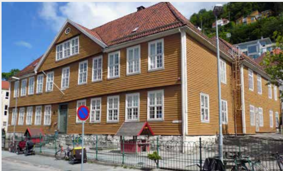
BERGENS BARNEASYL: Seminarium Fredericianum eller Bergens barneasyl på Asylplass 2 huser i dag Norges eldste barnehage. Bygningen er fra 1752, og huset opprinnelig et mer sekulært undervisningstilbud til elevene ved Latinskolen.

Overdaad ». Når noen hadde penger å avse, burde han eller hun (for banken skulle motta « smaae Summer af Personer af begge Kjøen, i Særdeles hed af Arbeids- og Tjenestefolk ») heller betroe pengene til banken enn å « nedlægge dem i de Huse, hvor man for Penge kjøber Døden i berusende Drikke ».