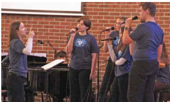
Sanctus fremførte sanger sammen med eget band

De første helgene i mai er det konfirmasjoner. Om du skulle møte en Åsane-konfirmant på din vei, så må du gratulere denne med fantastisk innsats denne dagen, både på gudstjenesten og ikke minst på fasteaksjonen etterpå.