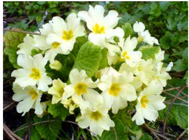
MEDLEM I NØKLEBLOMFAMILIEN: Kusymre er fylkesblomst for Hordaland. Lokalt på Vestlandet kalles den for kublom.