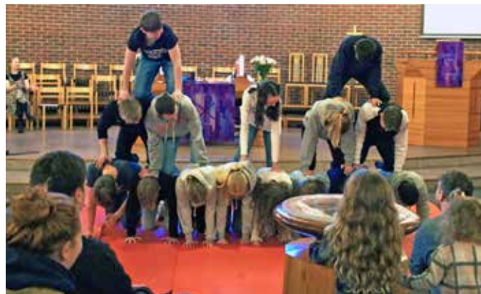
BYGGET MENNESKE-PYRAMIDE: KRIK-konfirmanter laget menneske-pyramide som viste trygghet og samarbeid.

Tematikken i Ung Messe handlet om Kirkens Nødhjelp sin