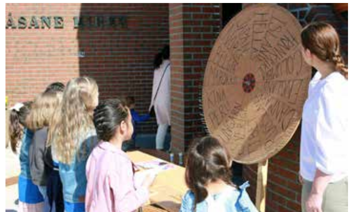
LYKKEHJUL: Store og små kunne prøve seg blant annet i rebusløp, fiskedam og lykkehjul.