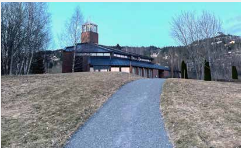
LEIRLIV I OSLO: Voksen kirke i Oslo fungerte som leirsted.

Ettermiddag og kveld ble tilbrakt i kirken, med alt fra bordtennis, uteleker og spontane sangstunder til avslapping, underholdning, og kveldsavslutninger i kirkerommet. Det var smil, latter og mye god stemning. En fantastisk fin gjeng å dra på tur sammen med, og mange gode minner er formet.