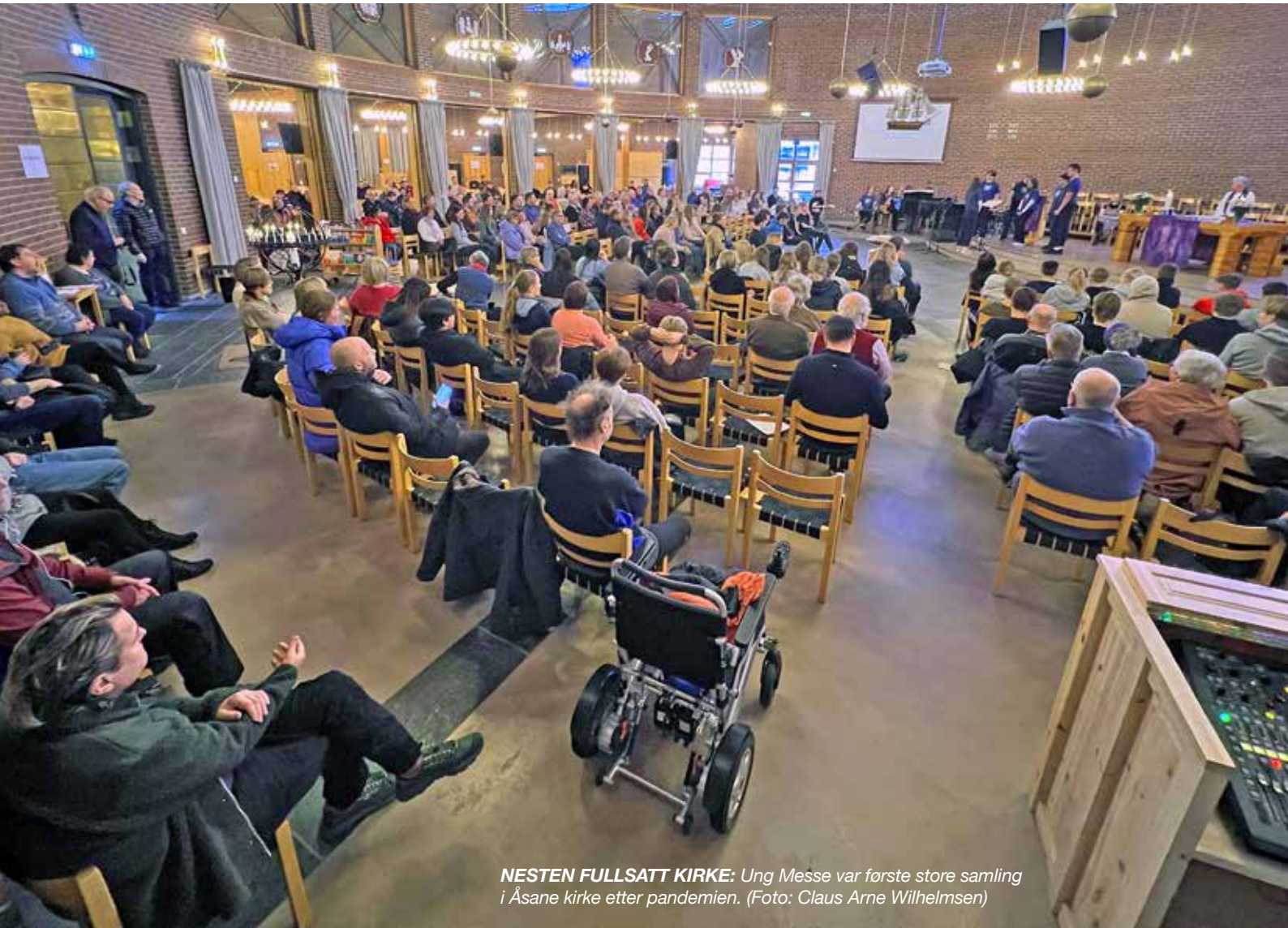
NESTEN FULLSATT KIRKE: Ung Messe var første store samling i Åsane kirke etter pandemien.

Søndag 3. april var alle konfirmantene i Åsane menighet, utenom Haukås, samlet for å gjennomføre Ung Messe. Kirken ble fylt opp av foreldre, ungdomsledere, frivillige hjelpere og menigheten ellers, oppunder 300 mennesker.