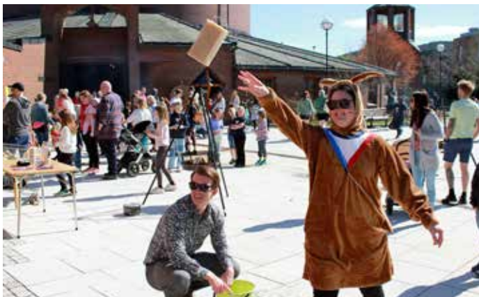
SVAMPEKAST: Mange aktiviteter foregikk i og rundt kirken.