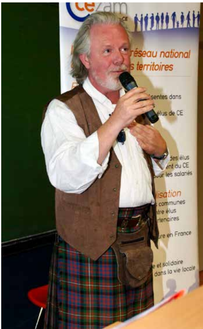
FORFATTER MED KILT: Peter May har mottatt flere priser for sine romaner, både i Europa og Amerika. Bildet er fra Strasbourg i 2011, der han, iført skotsk nasjonaldrakt, ble overrakt Prix Cezam Literature Award for boken «The Blackhouse» (første del i Lewis-trilogien).

beløp og en folder med noen dårlige kopier av avisutklipp hvor det står rosende ord om hans hobby som trener for ungdomsgrupper, men ingenting om hans yrke. Han aner ikke om pengene er stjålet eller er et slags honorar.