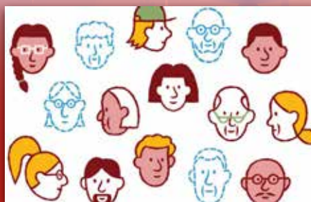
Førstehjelp ved sorg Side 17