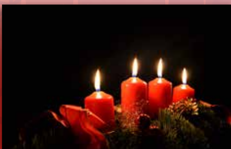
Jul i kirken Side 3