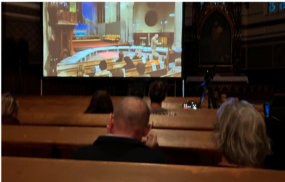
Under: Åpningskonserten under Autunnalen ble live streamet og remixet i Johanneskirken.