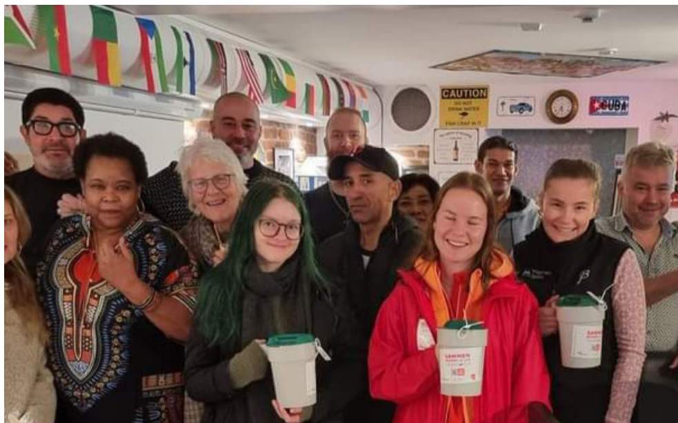
Over: Vertskap og bøssebærere ved årets TV-aksjon, samlet på Cafe Sanaa.