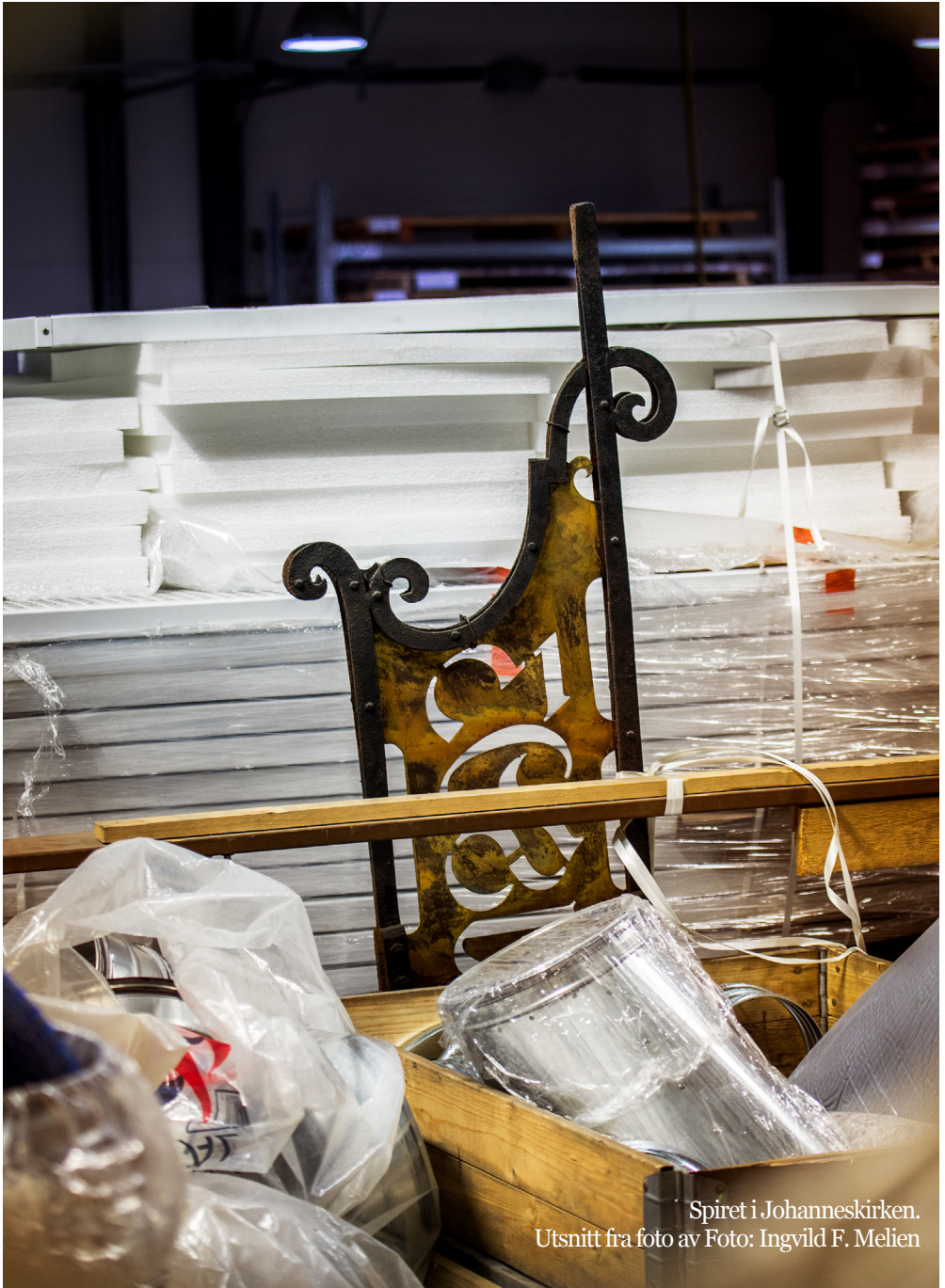
Spiret i Johanneskirken. Utsnitt fra foto av Foto: Ingvild F. Melien