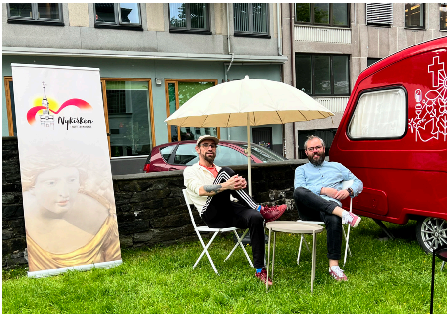
Over: Campingvognen "Kirken-på-hjul" kom på besøk under Familiedagen i Nykirken.