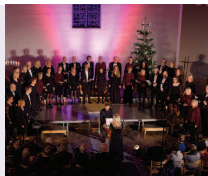
Sola Fide på en stemningsfull julekonsert i Skjold kirke. Koret vil også ha en konsert i Domkirken.

Sola Fide ble stiftet i 1989 som prostikor i Fana. Koret har et variert repertoar og opptre i mange ulike sammenhenger. Julekonsertene er et høydepunkt i året, både for koret og også mange korelskende tilhørere i bergensområdet. ●