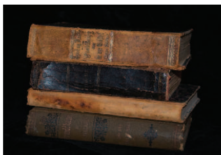
ANTIKVARISKE BØKER: Brukshyllen har alt fra bestselgere til antikkvariske samlereobjekter.

bokhandler har kanskje et lite utvalg av kristen litteratur, mens vi tar inn det meste som finnes i markedet.