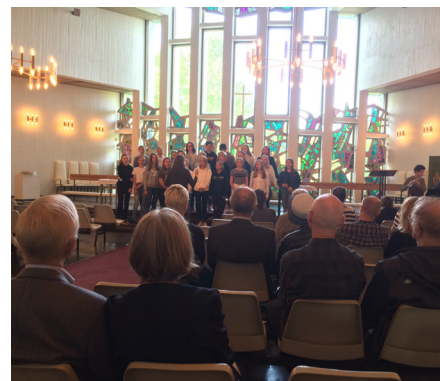
▲ Tensingkoret i aksjon