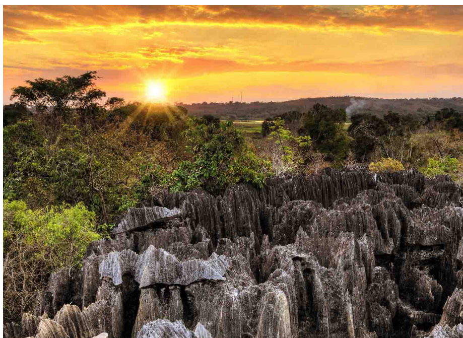
▲ VAKKERT: Madagaskar er et vakkert land som virkelig er værd et besøk.