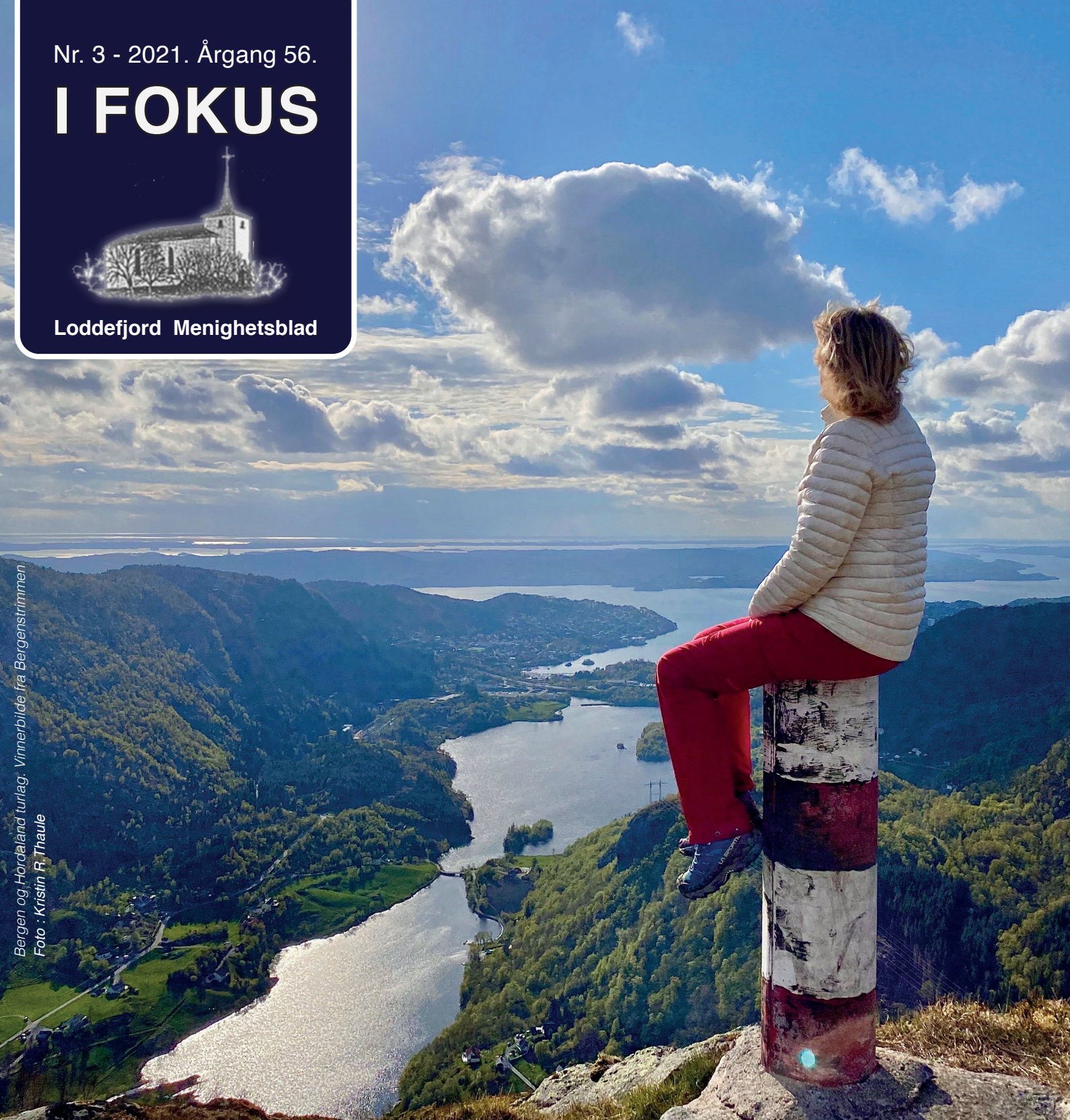
Bergen og Hordaland turilag. Vinnerbilde fra Bergenstrimmen