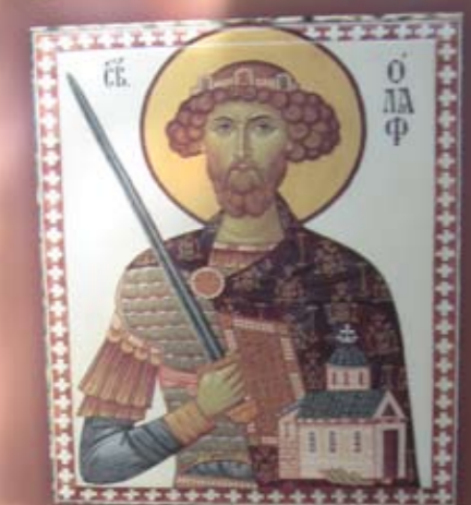
Millénaire du baptême de Saint Olav Roi et Patron de Normandie