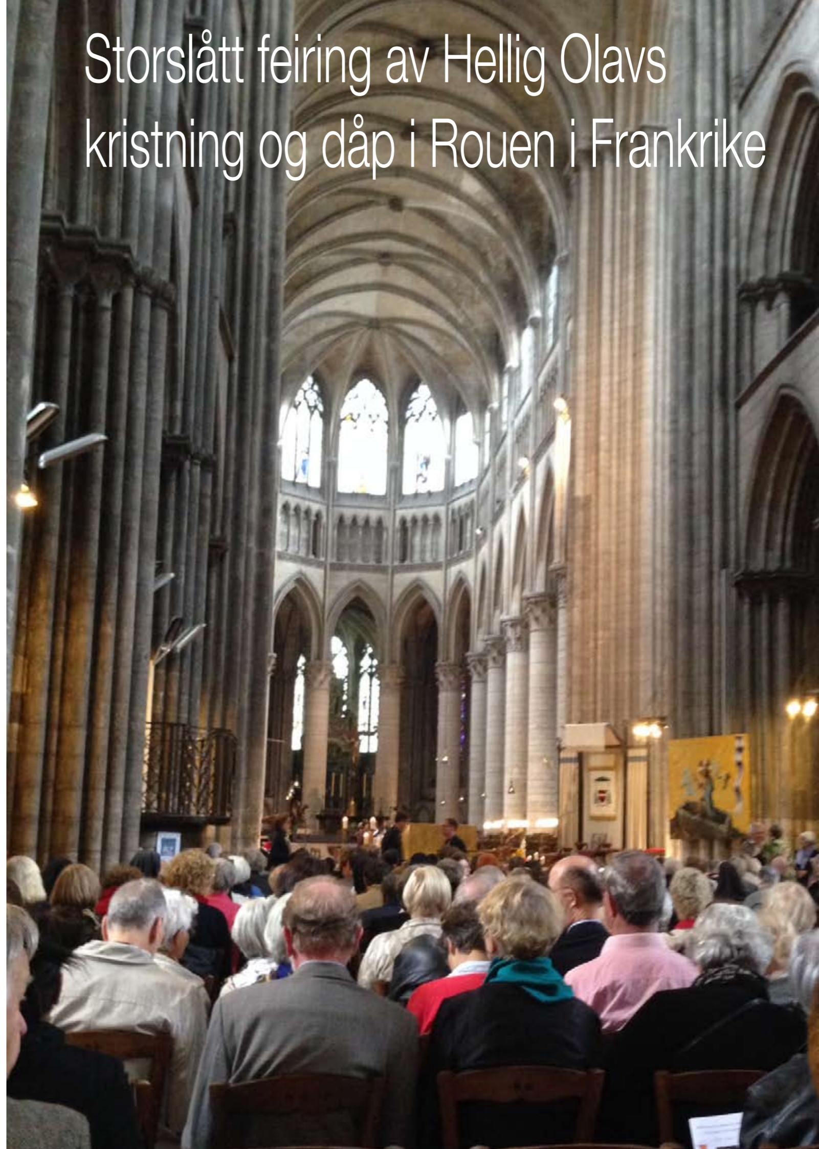
Cathédrale Notre Dame de Rouen