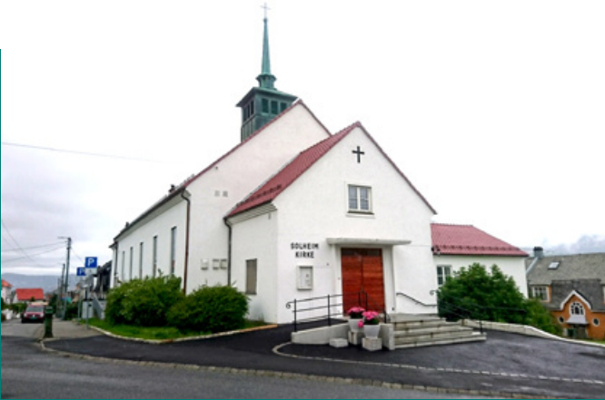
Solheim kirke – Hordagaten 28