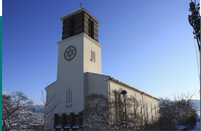
St. Markus kirke, Lien 45