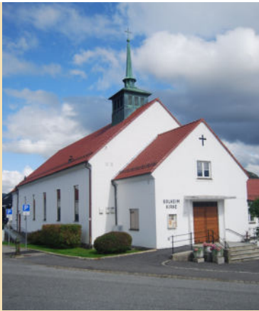
Solheim kirke Hordagaten 28