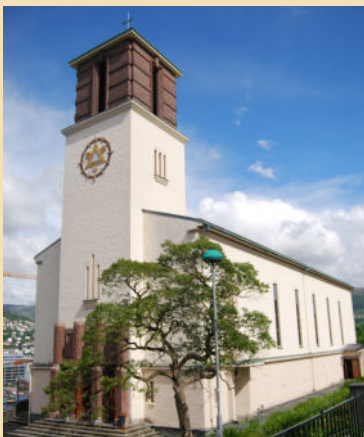
St Markus kirke Lien 45