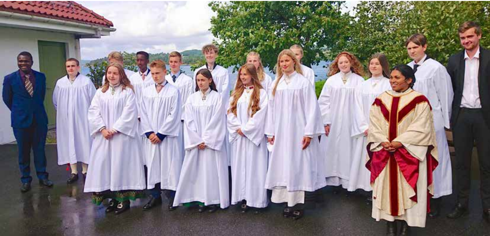
ENDELIG KONFIRMERT: Vi har blitt kjent med en fin gjeng ungdom som vi gjerne skulle ha fått mye mer tid sammen med.