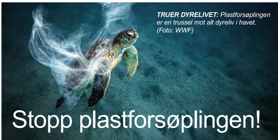
TRUER DYRELIVET: Plastforsøplingen er en trussel mot alt dyreliv i havet.