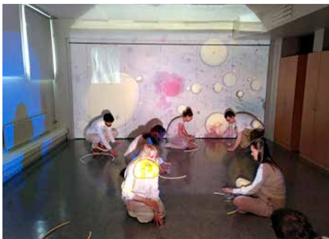
MUSIKKVERK OM BEDEHUS: «Bedehus» er tenkt som en opplevelse hvor publikum er både innenfor og utenfor – både betraktende og deltakende.