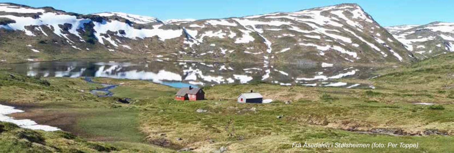
Frå Åsedalen i Stølsheimen

I sommar fekk eg to dagar i Stølsheimen. To sjeldne dagar med strålende sol, djupblå himmel, god temperatur og den fred og ro som berre høgfjellet kan gje.