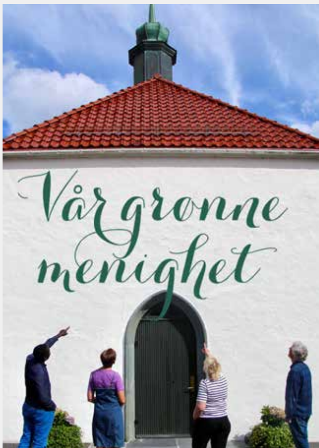
GRØNN MENIGHET: Både inngangsdøren og tårnet er allerede grønne. Nå gjenstår bare resten av kirken.

Vi er nå en del av et grønt nettverk på over 300 menigheter i Norge. Det gir grunn til å feire, samtidig som vi skal brette opp ermene og ta utfordringen på alvor.