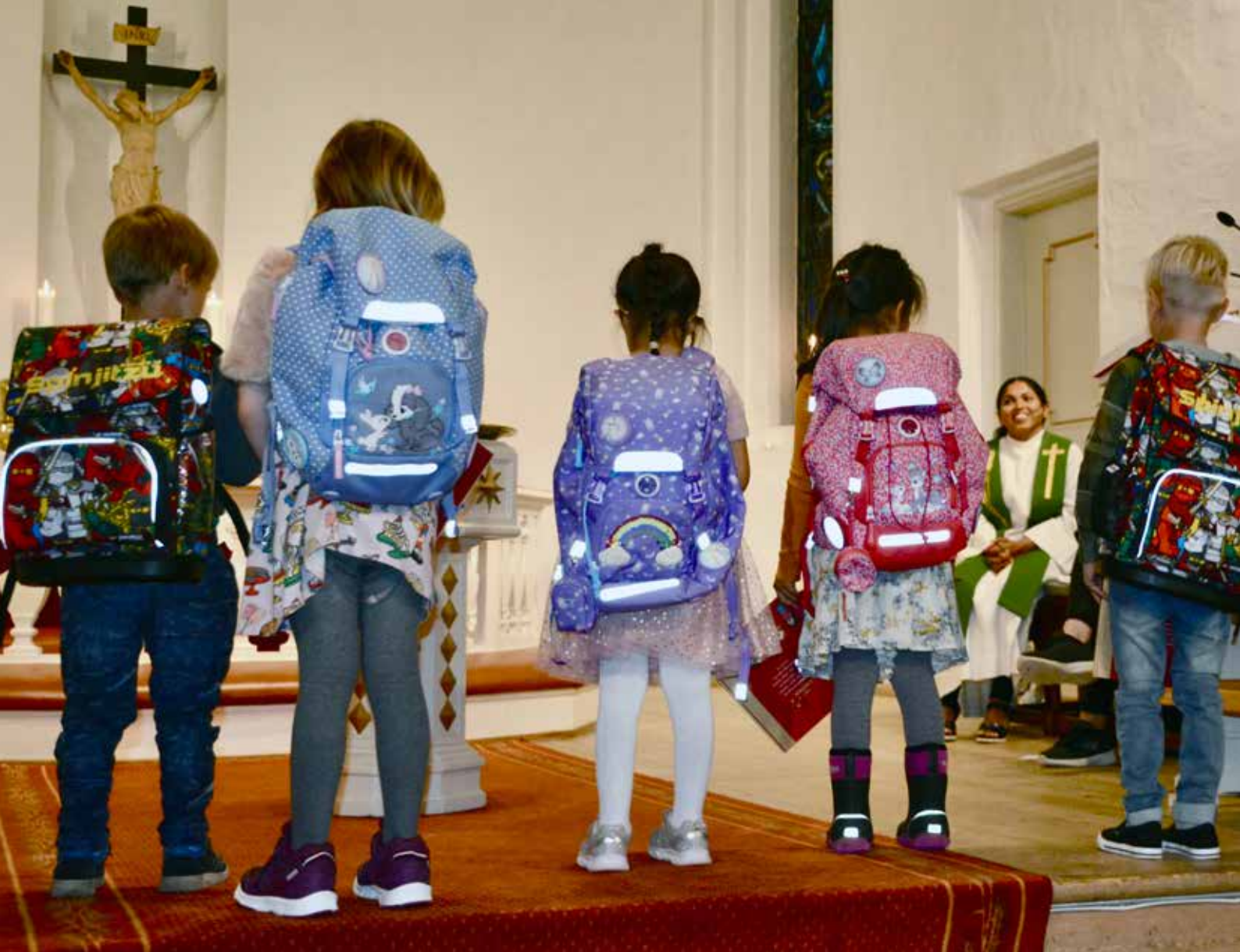
FIKK 6-ÅRSBOK TIL SKOLESEKKEN: Stolte førsteklasinger fikk vise fram sine nye ransler.