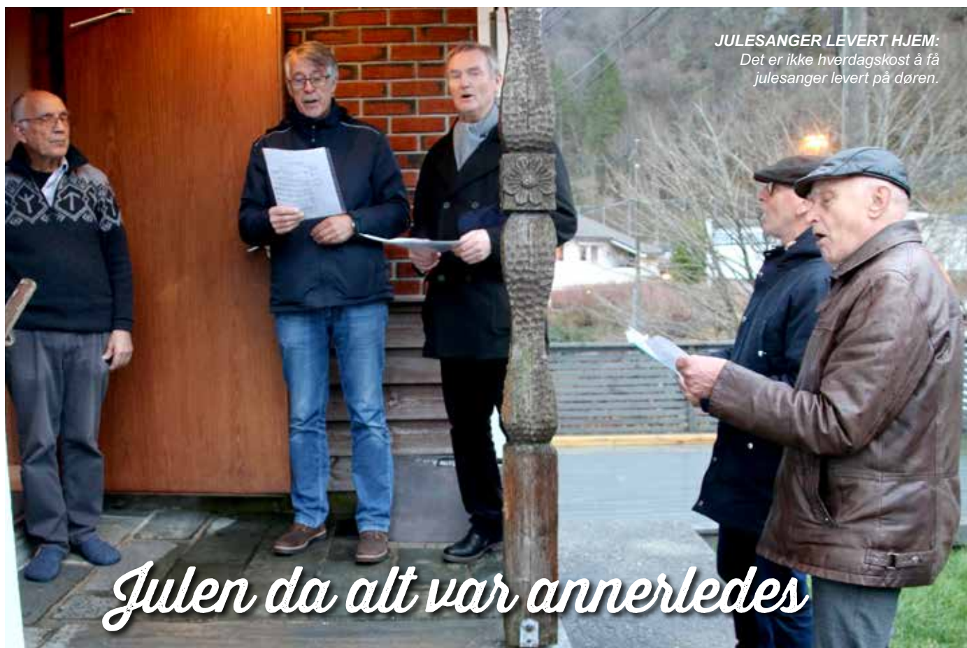
JULESANGER LEVERT HJEM: Det er ikke hverdagskost å få julesanger levert på døren.