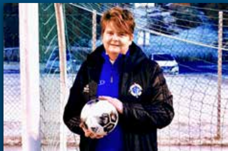
Giverglede i Bergen FK Nord