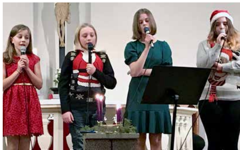
SYNGER JULEN INN: Julen ble nydelig sunget inn, blant annet av fire sangere fra barnekoret i kirken.

Vi legger bak oss en annerledes jul. Og vi har erfart at det ble jul likevel. Fordi julens hovedperson lager jul for oss like godt i en enkel, skitten stall som i en høytidspyntet kirke.