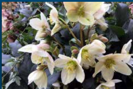
Juleroser til påske?