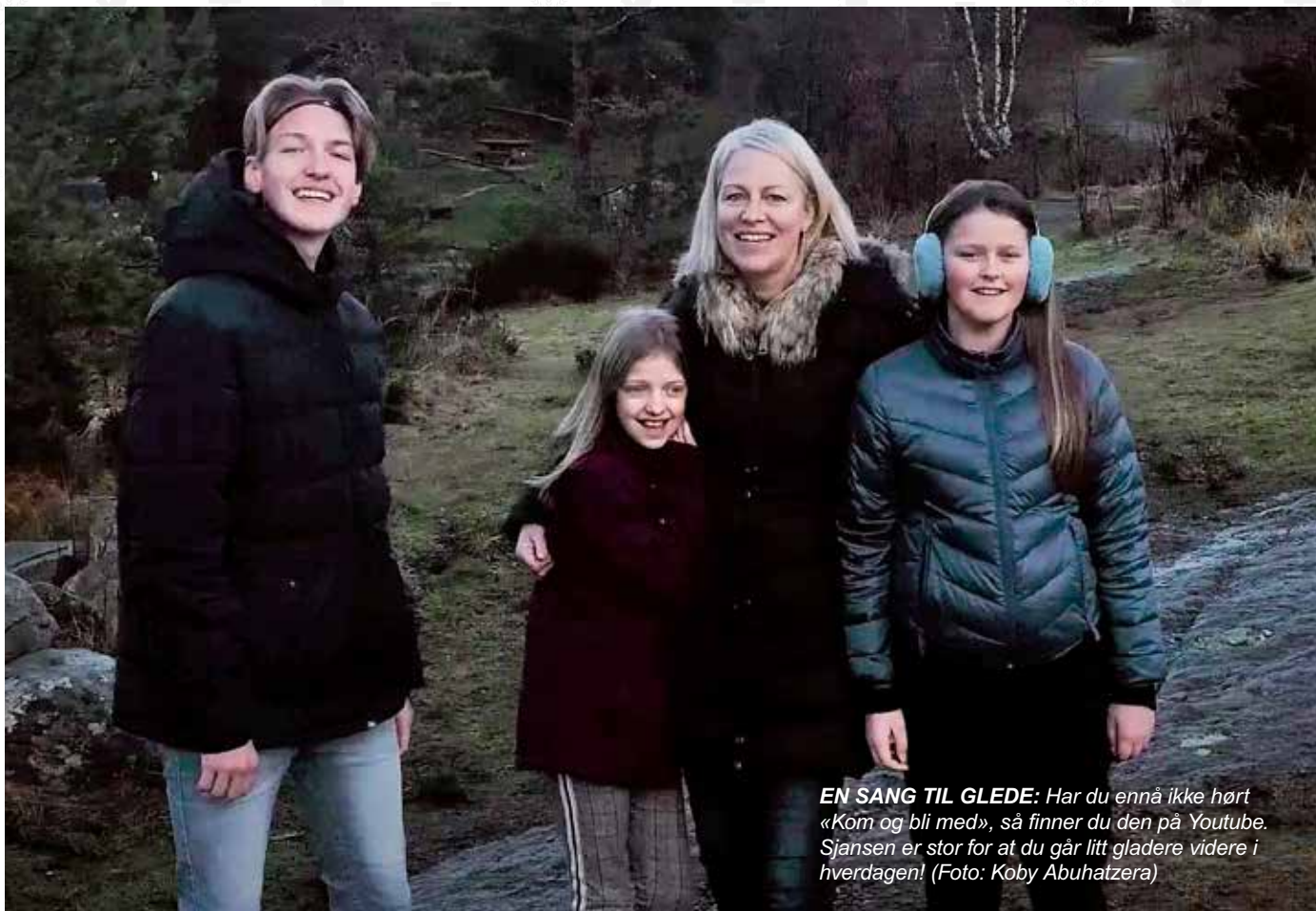
EN SANG TIL GLEDE: Har du ennå ikke hørt «Kom og bli med», så finner du den på Youtube. Sjansen er stor for at du går litt gladere videre i hverdagen!