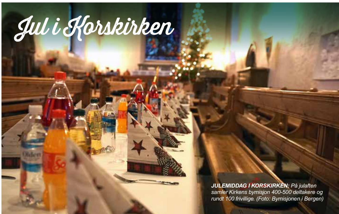
JULEMIDDAG I KORSKIRKEN: På julaften samler Kirkens bymisjon 400-500 deltakere og rundt 100 frivillige.

«Julaften med to skiver leverpostei og ei bikkje. Det er noe som suger, for å si det sånn».