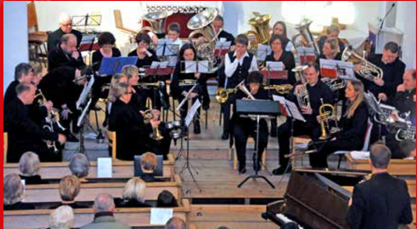
FULLE BENKERADER: Julekonserten er eit av årets musikalske høgdepunkt for dei som er med å setja tone til hendinga. Biletet er frå Julekonserten i 2011.

Til ut på 70-talet var to framsyningar av Julekonserten vanleg. I dag er det berre ei framsyning, men også på den er det fulle benkerader i den vakre kyrkja vår i Salhus. Frå heile