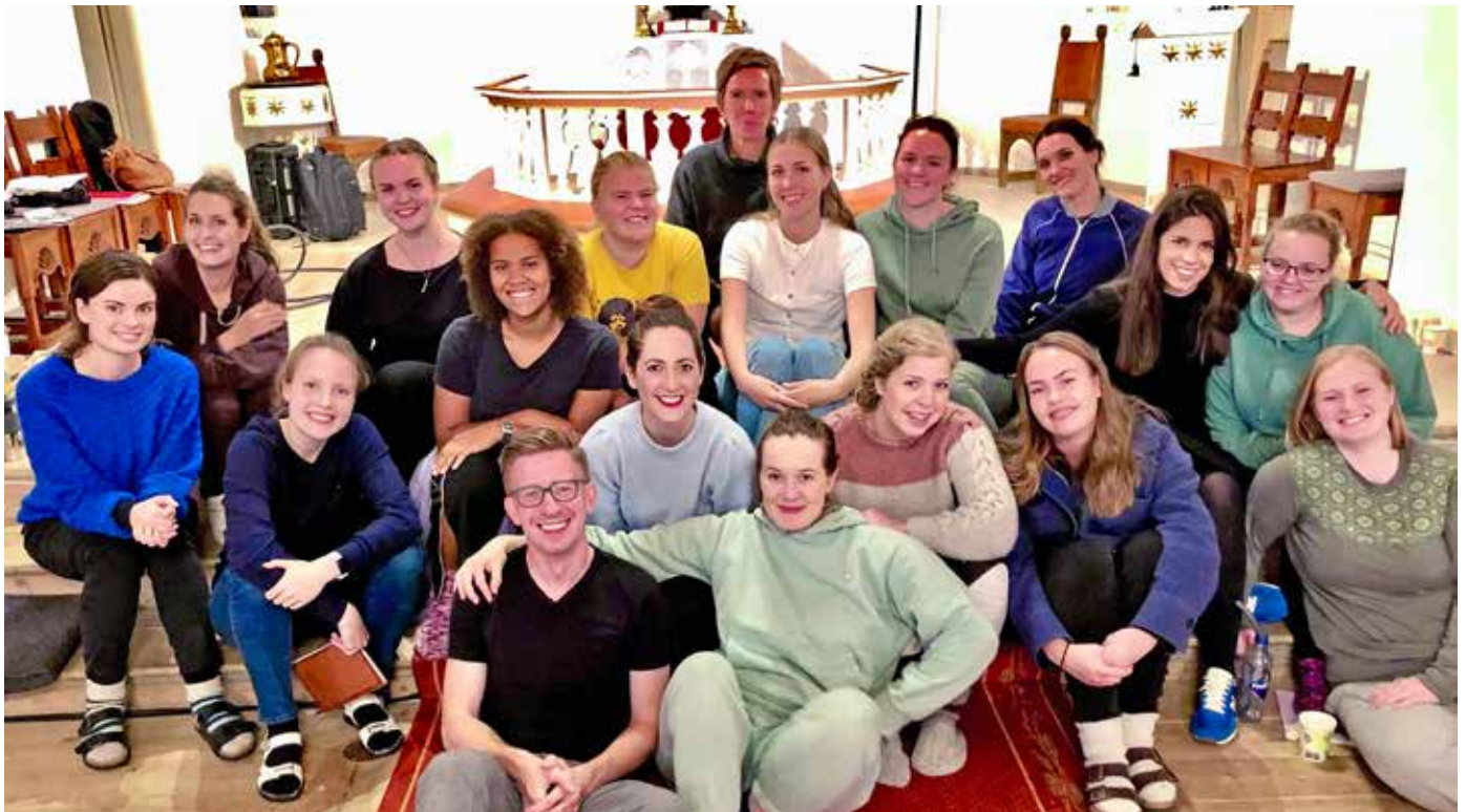
FANN DEI GODE HARMONIANE: Koret Multa Paucis saman med folkemusikkbandet Kvarts har spela inn juleplate i Salhus kyrkje, der dei hadde fire intense, slitsomme og gøye dagar.

Ei langhelg i september var det berre snøen som mangla på julestemninga i Salhus kyrkje. Klokkeklare juletonar frå koret Multa Paucis i følge med folkemusikkbandet Kvarts vart fanga inn av produsent Berit Opheim. Til jul kan du kjøpe plata med julesongar som blei spelt inn her.