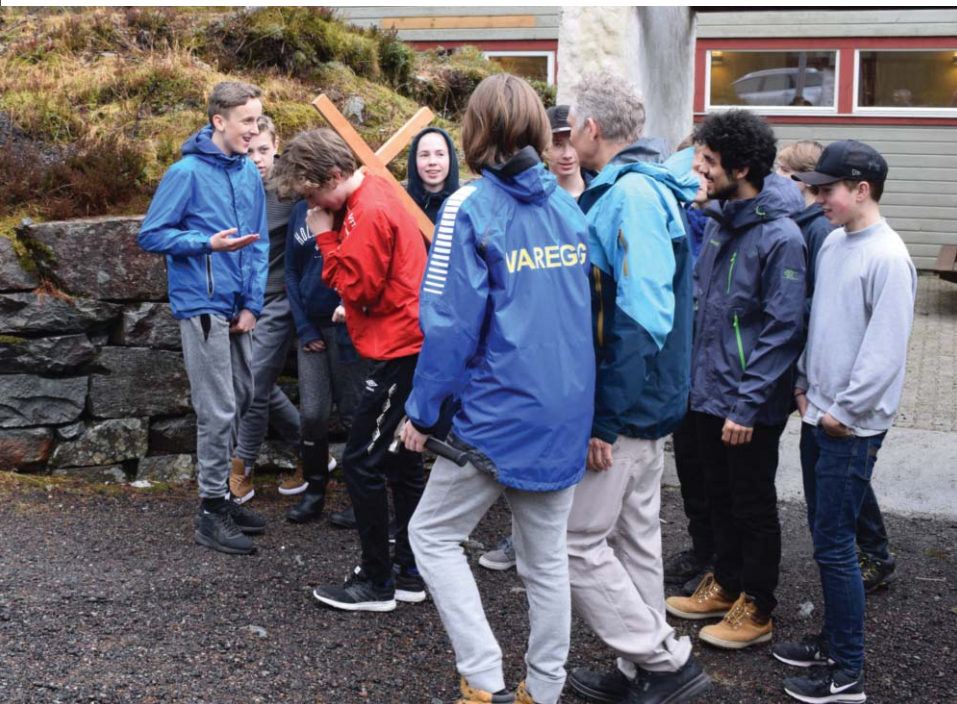
Over: Fra påskevandringen langfredag: Jesus bærer korset. Under: Fra påskevandringen palmesøndag: Jesus rir inn i Jerusalem.