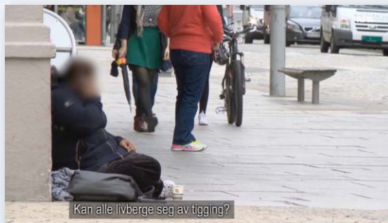
Kan alle livberge seg av tiggere?

han som tråler Sandvikens søppelkasser etter tomflasker drives av fattigdom.