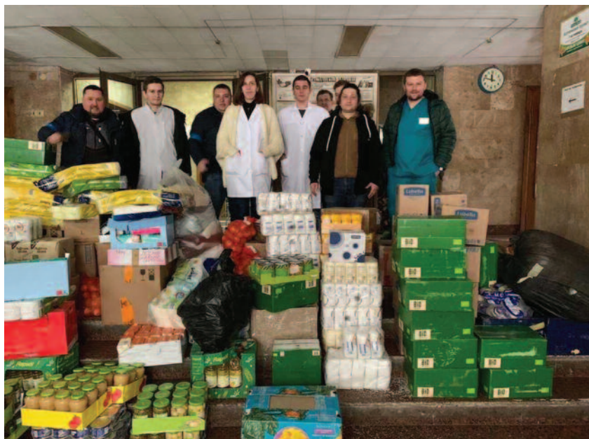
Europas befolkning har samlet seg om å hjelpe sivile i Ukraina med mat, klær og husly. Også en rekke frivillige norske organisasjoner bidrar.

– THK opplever en utrolig giverglede blant både folk og bedrifter som ønsker å bidra, sier daglig leder i Stift-