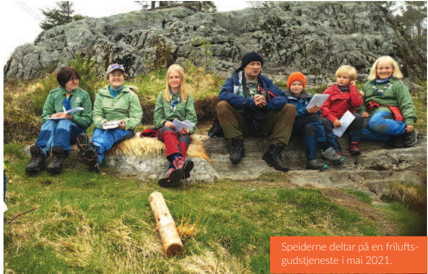
Speiderne deltar på en friluftsgudstjeneste i mai 2021.

hver torsdag i aldersinddelte grupper. For mer informasjon, se www.sbkor.no og eget oppslag i dette bladet.