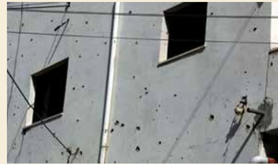
KULEHULL: Tydelige merker etter kuler i betongveggen på dette huset.

Sønnen hadde deltatt i en ikkevolds-demonstrasjon mot muren som skulle bygges rett utenfor landsbyen. Historiene er mange. Av en annen,