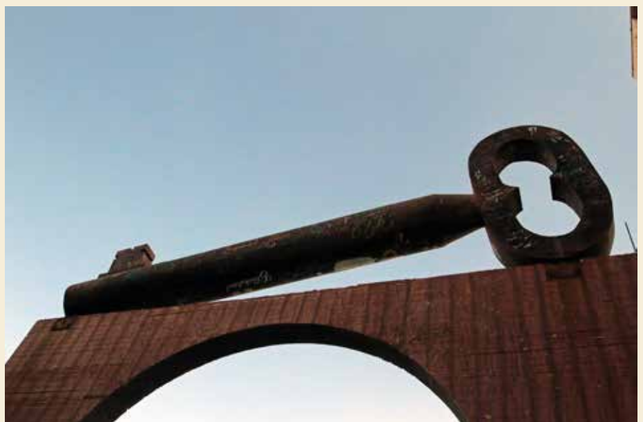
HÅPETS NØKKEL: 15. mai 1948 erklærte Israel landet som egen stat. FN hadde tilkjent en del av territoriet til jødene (54 prosent), og en til palestinerne (46 prosent). 700.000 palestinere måtte dermed forlate alt de eide, unntatt det de kunne bære i hendene eller transportere på esel og kjerre. Men nøkkelen til hjemmet sitt tok de med. «For en dag kommer vi tilbake!» sa de. Denne nøkkelen er plassert over inngangen til Ayda flyktningeleir utenfor Betlehem.

Gamlemor sitter og lytter. Hun kjenner visst alle barna som løper forbi. Roper til dem. Hun er som en sol av godhet. «Mor-Ayda!» roper en gutt, «se!» Han har laget et brett av ei fjøl han har tatt fra ei dør, og prøver å få den til å gli på et jern. Han stuper framover. Men reiser seg og børster støv av buksene.