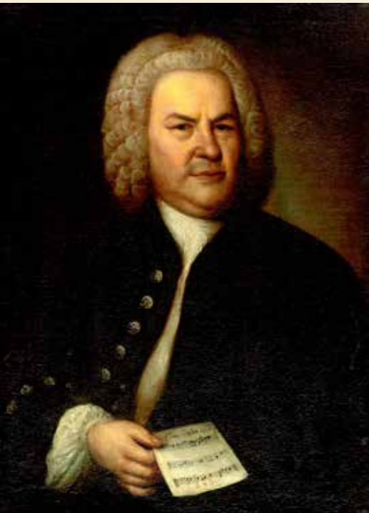
«MARKUSPASJONEN» I BERGEN DOMKIRKE (3. APRIL): «Bachs samlede verker» svarte biologen og forfatteren Lewis Thomas da han ble spurt hvilken musikk han ville sendt ut i verdensrommet sammen med Voyager-sondene. «Men det ville nok blitt oppfattet som skryt», la han til. Det er mulig han hadde et poeng. Richard Wagner mente at Johann Sebastian Bach var «det mest overveldende mirakel i all musikk», og han er helt klart både påskens og alle andre kirkelige høytiders komponist fremfor noen. (Illustrasjon: Bach-portrett malt av Elias Gottlob Hausmann)