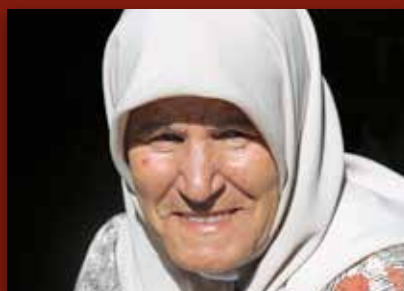
Reisebrev frå Palestina: På flukt i 67 år Side 14-15