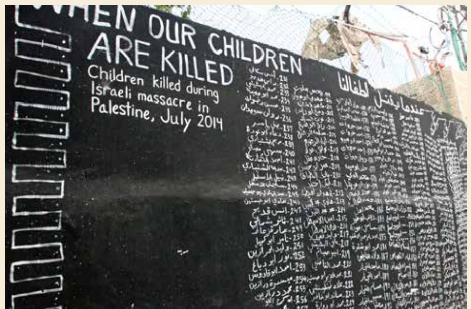
DYSTER DOKUMENTASJON: Navnene på alle barna som ble drept i Gaza sommeren 2014.