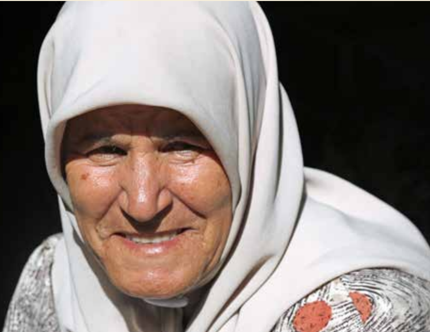
ET LIV PÅ FLUKT: Hun var ti år gammel da hun måtte flykte. Fortsatt venter hun på å få komme hjem.

Jeg finner henne i et portrom i flyktningeleiren. Foran ei åpen dør. Hun smiler mot meg og peker på en stol. Vi kommer i en slags prat.