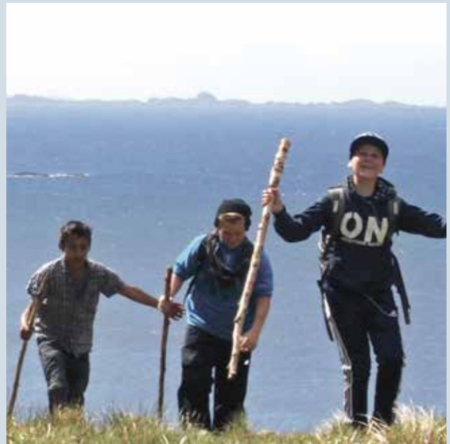
Pilegrimar langs kystpilegrimsleia.

Meir informasjon: www.kirkeaktuelt.no/kyrkjeleg-pilegrims-konferanse/ Bindande påmelding innan 27. mars. Arrangør er Kyrkjerådet/Nasjonalt kyrkjeleg pilegrimsutval, Bjørgvin bispedøme og Selje kommune.