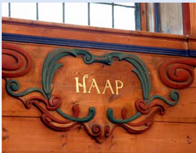
TIL ETTERTANKE: Det er mulig å finne håp i Laksevåg kirke.

Det er mulig å finne håp i byens kirker. I Laksevåg kirke står ordet «haap» skrevet med store bokstaver under et av vinduene. Den som vandrer inn i kirkerommet, vil se dette og flere andre ord under vinduene.