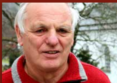
Arna kyrkje 150 år: Skreiv jubileumsboka Side 2-3