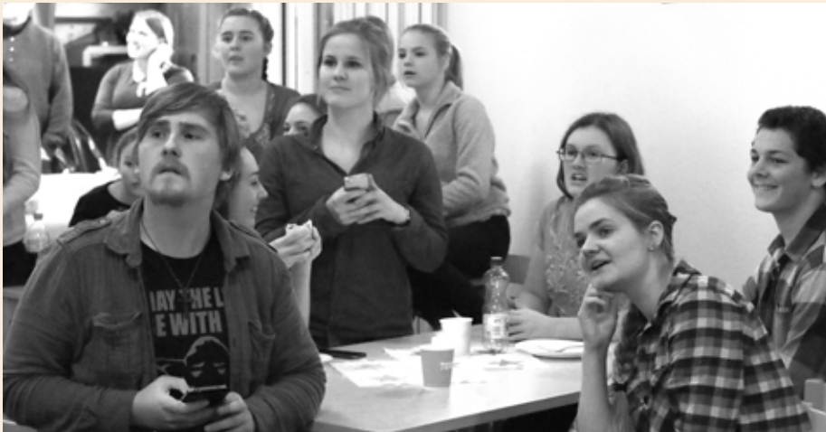
FØRSTE TREFF I SALHUS: Ungdomssatsingen «Thank God It's Friday» hadde sitt første treff i Salhus menighet 14. november 2014. Da kom det 70 ungdommer.

Gjennom fellessamlinger for alle ungdommene i hele prostiet håper en å skape engasjement for å være aktive i kirken også etter endt konfirmasjonstid.