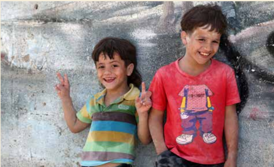
INGEN LEKEPLASSER: I seks flyktningeleirer har jeg lett etter lekeplasser, men ikke sett noen. Barna sier at de ikke finnes.

– Norge, hvor er det? spør hun. Jeg har aldri hørt om det landet?