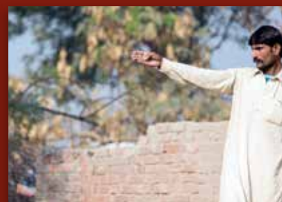
Fasteaksjonen: Flaumen tok alt Side 13