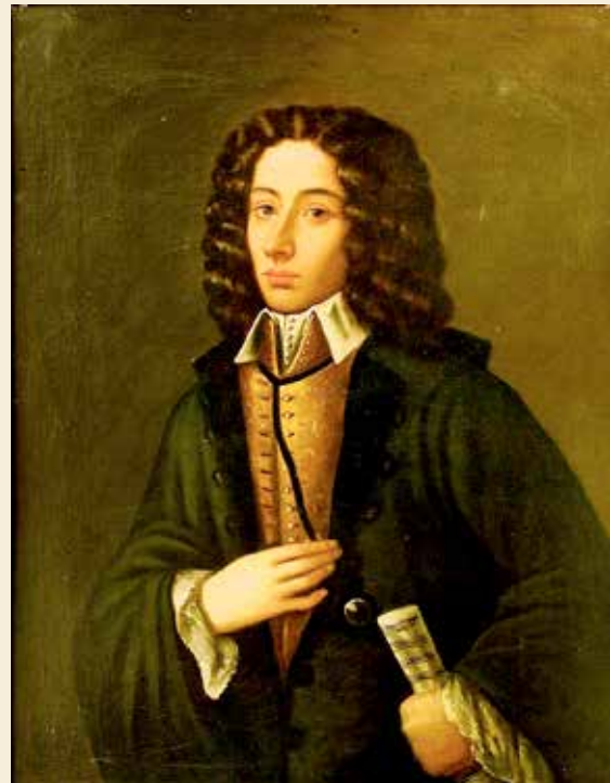
«STABAT MATER» I FRIDALEN KIRKE (3. APRIL): Hadde den italienske komponisten Giovanni Pergolesi (1710-1736) fått leve i mer enn 26 år, ville han sannsynligvis vært regnet blant de helt store i dag. Hans «Stabat Mater» («her står moren») er en av de mest gripende musikalske tolkningene av denne 1300-tallsteksten; skrevet av fransiskaner-munken Jacopone da Todi, og med utgangspunkt i Jesu trøstende ord til sin mor ved korset (Joh. 19:25-27). (Illustrasjon: Ukjent kunstner, sannsynligvis et portrett av Pergolesi)