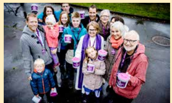
DITT BIDRAG BETYR MYE: Et par timers innsats med bøsse på aksjonsdagen gir mange av verdens mest sårbare mennesker muligheten til å jobbe seg ut av fattigdom.