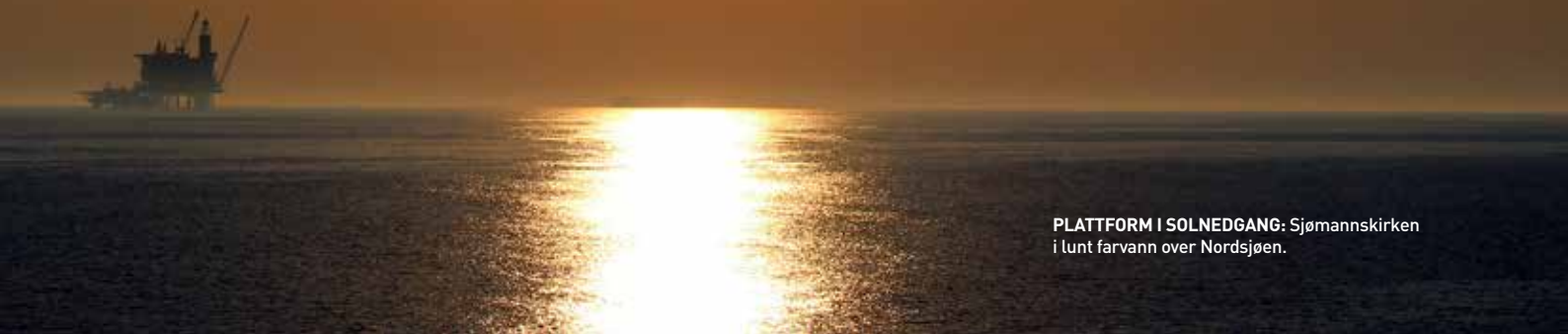
PLATTFORM I SOLNEDGANG: Sjømannskirken i lunt farvann over Nordsjøen.

Midt under «Tall Ships Race» kaster MS Gann fortøyningene og stevner ut forbi gamle seilskuter, som viser oss hvordan skipene så ut den gang Sjømannskirken startet opp sin virksomhet.