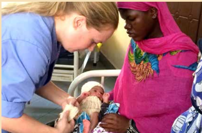
ULLKLEDE TIL TANZANIA: Denne vesle jenta held varmen i ullklede frå Arna.

Vi har tidlegare skrivne om konfirmantgruppa som engasjerte seg i Strikk for livet, ein organisasjon som samlar inn strikka klede til nyfødde ved Haydom Lutherske sjukehus i Tanzania.