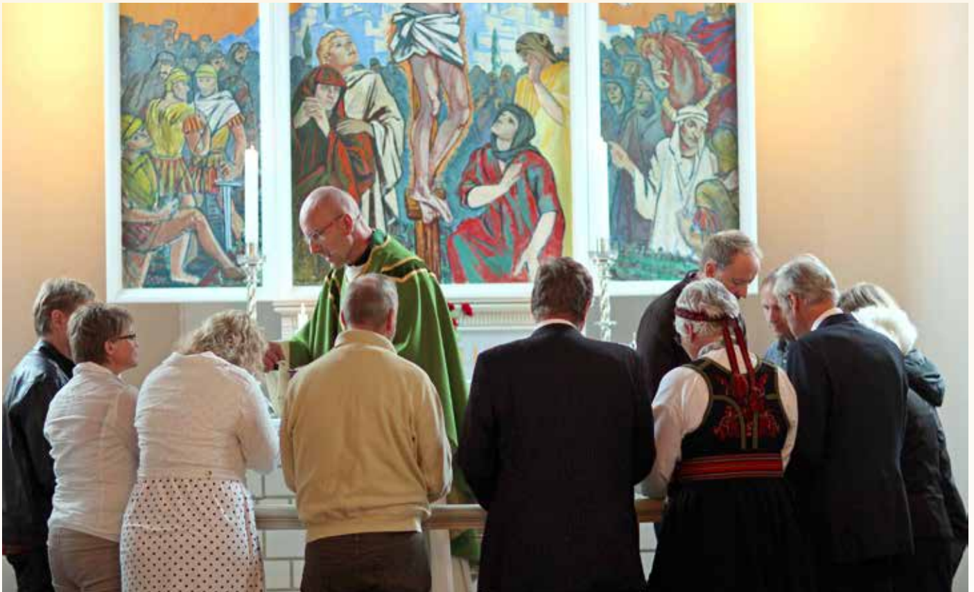
NATTVERDSMÅLTID: Den nye soknepresten inviterer til fellesskap med Jesus.