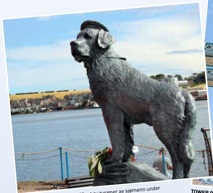
MARINEHUNDEN BAMSE: Kjent av tusener av sjømenn under krigen skuer Bamse fortsatt ut over havnen i Montrose.

menneske kan utrette. Hamburg ble fullstendig utbombet under krigen. Det største angrepet skjedde den 28. juli 1943, da store brannstormer herjet og over 40.000 sivile ble drept. Også sjømannskirken ble rammet, med den triste følgen at vaktmesteren omkom da han prøvde å redde noe av utstyret. Nå finner vi en moderne og fin kirke på stedet, til glede for sjøfolk, fastboende og turister.