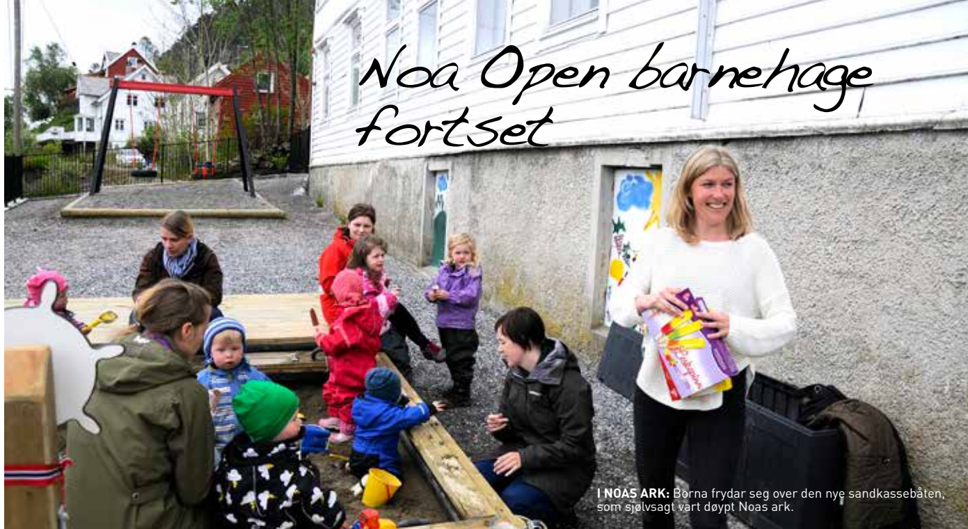
I NOAS ARK: Borna frydar seg over den nye sandkassebåten, som sjølsagt vart døypt Noas ark.