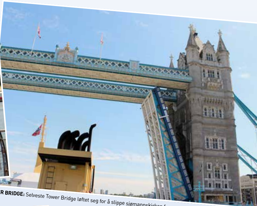
TOWER BRIDGE: Selveste Tower Bridge løftet seg for å slippe sjømannskirken frem.