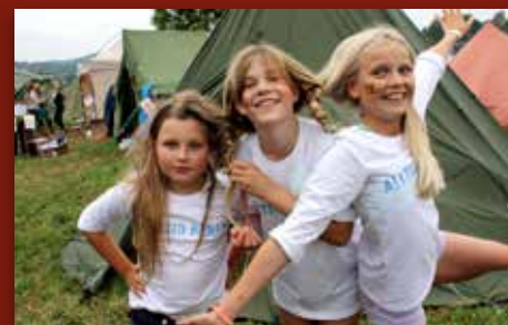
Hilsen fra landsleiren Side 10-11