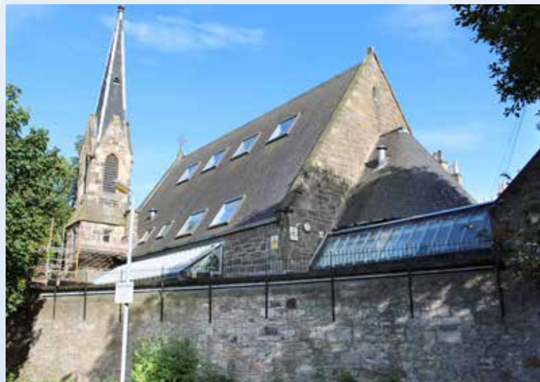
DEN FØRSTE SJØMANNSKIRKEN: Den tidligere sjømannskirken i Leith i Edinburgh er nå blitt kunsthøyskole.

Nordsjøen ligger blank og innbyende fremfor oss. Knappt en bevegelse kjennes i skipet. Solen skinner og kaster sine sølvstråler over et dypt blått hav. Vi passerer oljeplattformer, som forteller oss at det ikke lenger gjelder at «Vår ære og vår makt, har hvite seil oss brakt». Nå er det oljepengene som gir oss makten, i alle fall for noen år fremover. Vi er på vei til Skottlands oljehovedstad Aberdeen, med en av