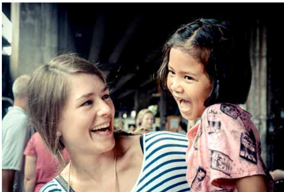
EIN TRYGG STAD: Blidt møte med borna på Lovsangshjemmet.