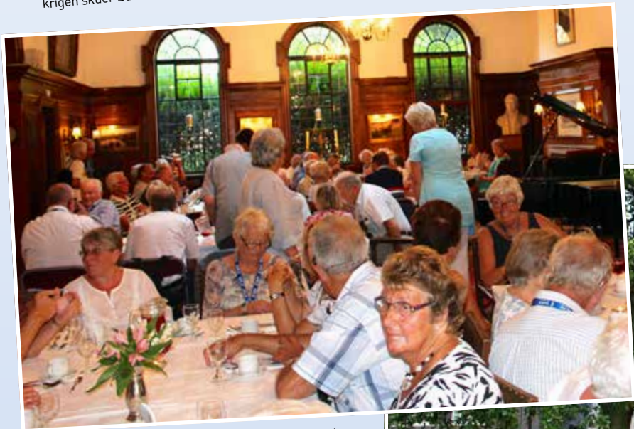
ST. OLAVS KIRKE: Fest på sjømannskirken i London.