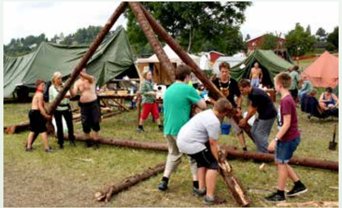
SAMARBEIDER: Bygging av en stor portal krever både krefter, dyktighet og godt samarbeid mellom Eidsvåg, Morvik og Biskopshavn.

en fellessamling om hva kristendom er for noe. KFUK-KFUM-speiderne ønsker å være et ledd i kunnskapsformidlingen om kristendom, og også være en støtte for de foreldre og faddere som har gitt et løfte ved barnedåpen.