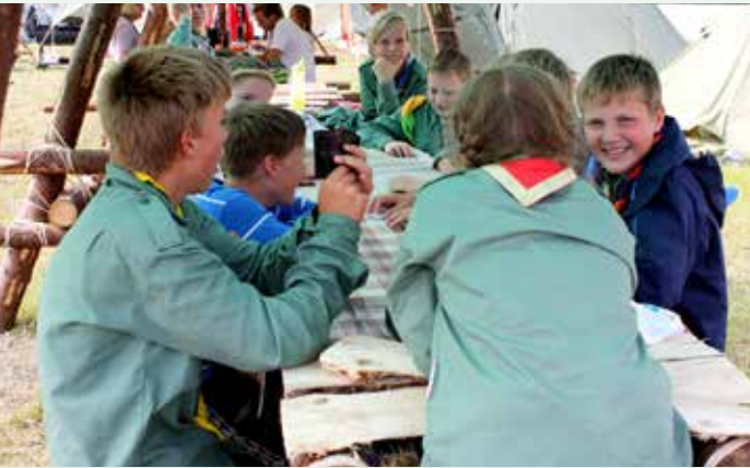
GOD STEMNING: Morvikspeiderne tar seg en velfortjent kvil med litt kortspill og munter prat.