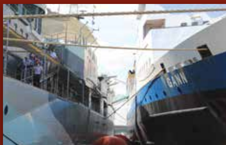
På jubileumscruise med Sjømannskirken • Side 6-7