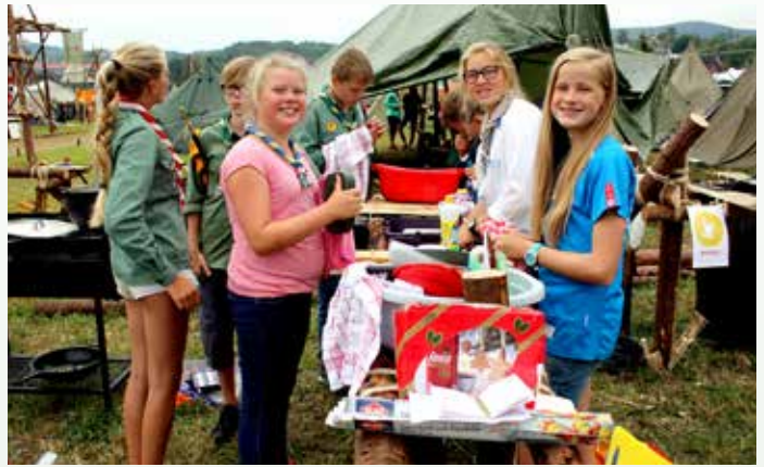
OPPVASKGJENGEN: Eidsvåg-speiderne klarer seg uten oppvaskmaskin