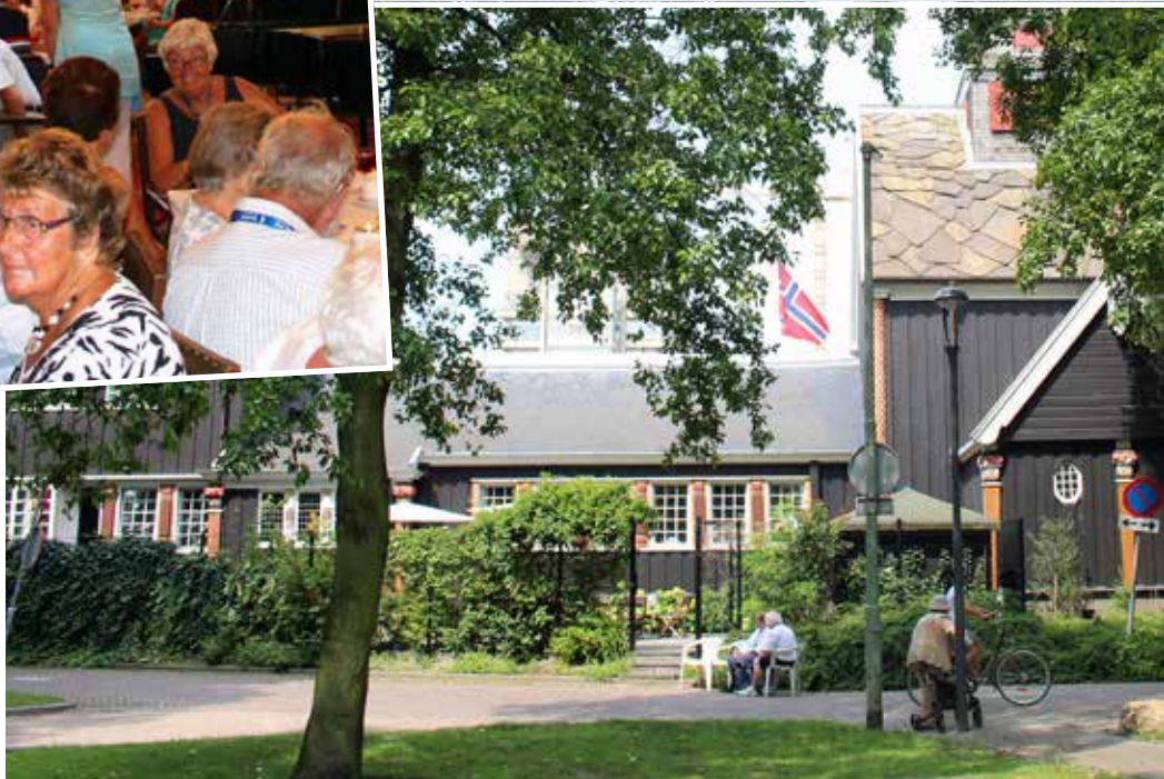
KIRKEN I SKOGEN: Sjømannskirken er Rotterdams største trehus, og ligger på byens høyeste punkt – en halv meter over havet.