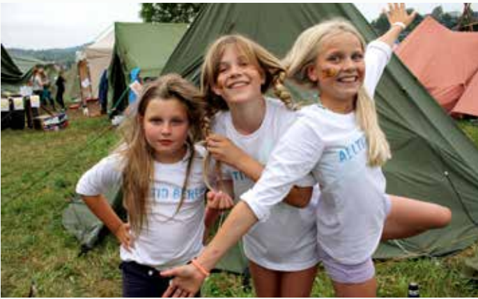
TESTER MOTTOET: Leirens motto var «Tett på!», og blir her demonstrert ved at tre Biskopshavn-speidere fletter hårene sine sammen.