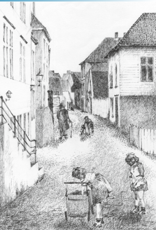
EN ANNEN TID: Lykkelig og bilfri barndom i Ytre Markevei. (Illustrasjon: Tegning av Elin Corneliussen)

TEKST: KNUT CORNELIUSSSEN. TEGNING: ELIN CORNELIUSSSEN.