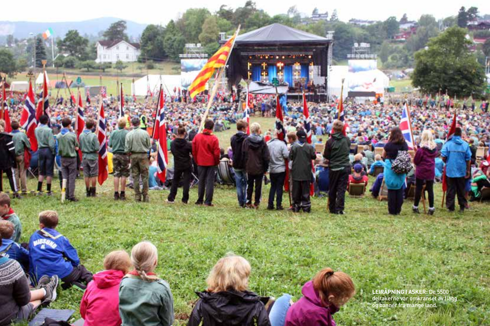
LEIRÅPNING I ASKER: De 5500 deltakerne var omkranset av flagg og banner fra mange land.