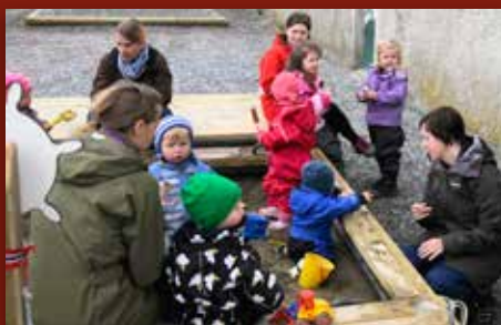
Framleis open barnehage Side 4