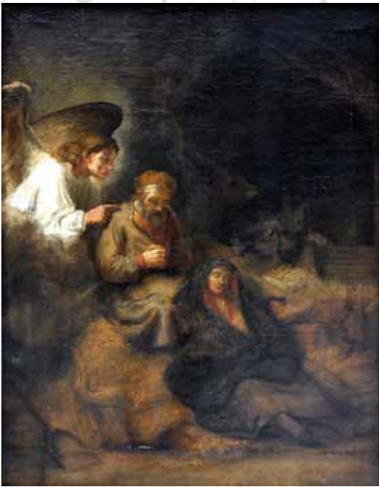
JOSEFS DRØM: Rembrandt (1606-1669) har skildret Josefs drøm: engelen som kommer til et utslitt og sovende par med et nyfødt barn; i en helt alminnelig stall.