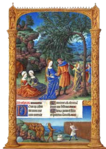
VAKKER BOKSIDE: Jesus befaler daddelpalmen å bøye seg for å gi frukt til de sultne veifarende. Fra det illuminerte manuskriptet Très Riches Heures du Duc de Berry («Hertugen av Berrys svært rikt utsmykkede tidebok»), laget av brødrene Herman, Paul og Johann Limbourg.

Da Herodes var død, kom engelen på ny til Josef i en drøm og sa at de trygt kunne vende tilbake. « Han sto da opp, tok med seg barnet og barnets mor og