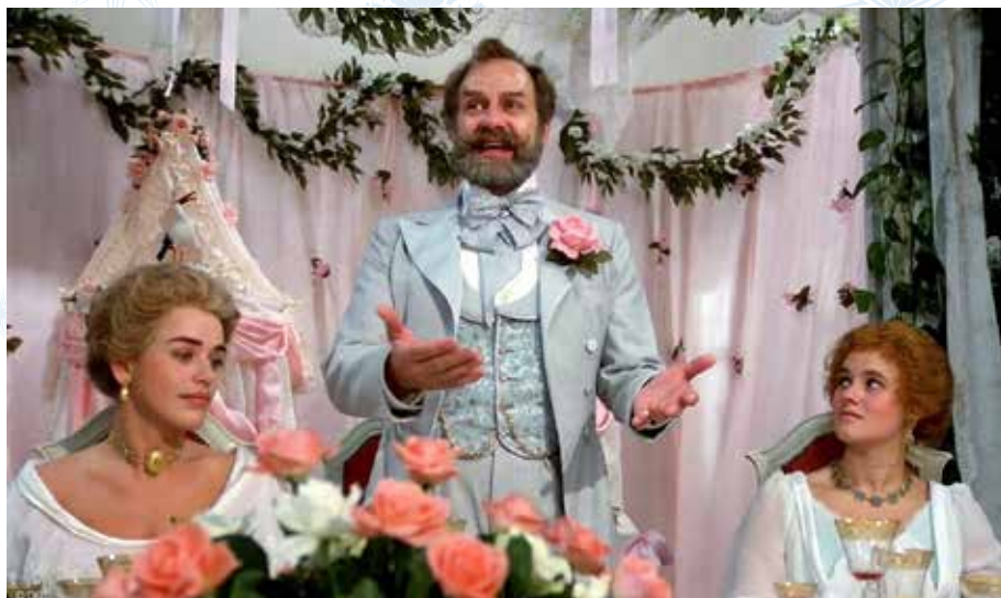
VIKTIG JULEBUDSKAP: Gustav Adolf råder sine nærmeste til, i god kristen ånd, å være snille, generøse, milde og gode.

Tv-versjonen av Fanny og Alexander er inndelt i fem episoder, og er nesten dobbelt så lang som filmen (totalt 312 minutter mot filmens 188). Dermed passer den fint til å deles opp i passende konfektdoser frem mot jul. For julen står sentralt i denne fortellingen, som både begynner og slutter med julefeiringen hjemme hos de to barnas livsglade mormor Helena Ekdahl (Gunn Wållgren).