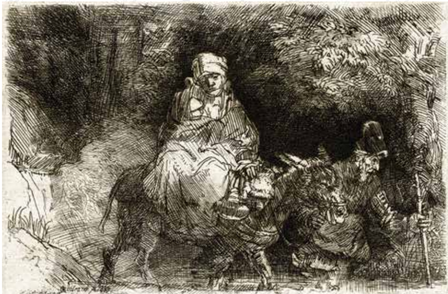
PÅ FLUKT: Rembrandt (1606-1669) laget flere tolkninger av flukten til Egypt. Dette trykket er fra 1654, og viser den lille familien idet de krysser over en elv.

Det var av politiske grunner at et nyfødt barn ble drevet på flukt sammen med sin familie for omtrent 2000 år siden.