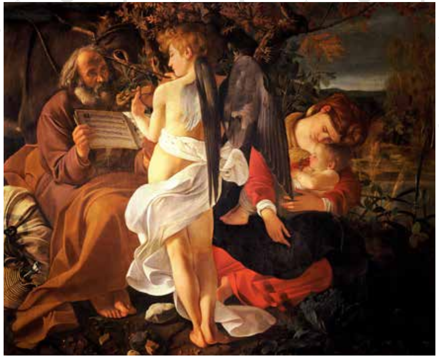
HVILEPAUSE: Caravaggios (1571-1610) frodige bilde av Josef som holder noteheftet for engelen som spiller Maria og Jesus i søvn.

kom til Israels land. Men da han fikk høre at Arkelaos var blitt konge i Judea etter sin far Herodes, våget han ikke å slå seg ned der» (Matt. 2, 21-22). Arkelaos var en like voldelig rå hersker som sin far. Familien slo seg derfor ned i Nasaret. «Slik skulle det ordet oppfylles som er talt gjennom profetene, at han skulle kalles en nasareer» (Matt. 2, 23)