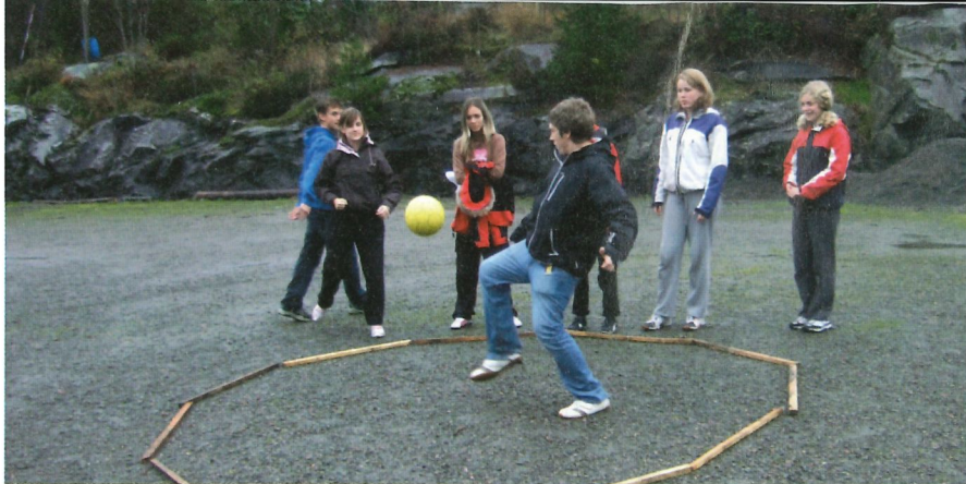
Stor innsats under sporlek på konfirmantleiren på Raknestunet på Osterøy