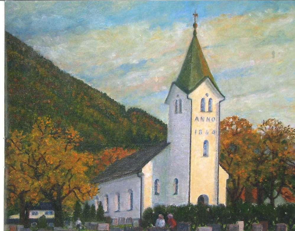
Fremtidens kirkeordning under debatt. Arna kirke malt av Sverre Myklebust på Espeland i Arna

Menighetsrådene i Åsane, Arna og Ytre Arna har i sine høringsuttalelser til Kultur- og kirke departementet enstemmig gått inn for å avvike statskirkeordningen og endre Grunnlovens paragraf 2. I Eidsvåg menighetsråd går seks av medlemmene inn for avvikling, mens tre ønsker fortsatt statskirke. I Salhus menighetsråd vil fire av medlemmene oppheve statskirkeordningen, mens tre medlemmer vil beholde den. I Biskopshavn menighetsråd er det et flertall på seks som vil at statskirkeordningen skal fortsette, mens to medlemmer vil oppheve den. I sin uttalelse fremhever Åsane menighetsråd behovet for å understreke at Den norske kirke er et selvstendig trosamfunn som skal ha rett til å utpeke sine ledere, dvs biskopene, uten statlig innblanding. Etter dagens kirkeordning er det regjeringen som utnevner biskopene i Den norske kirke.