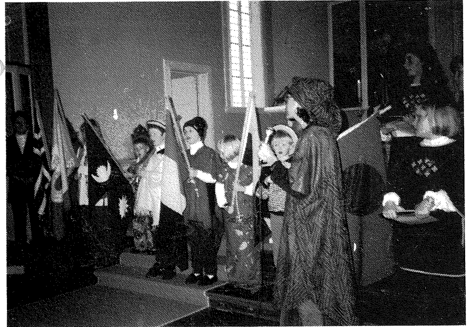
Born frå Haugland S-klubb med flagg frå misjonslanda.

I mange år har ein søndag i februar vore markert som «Borna sin misjonsdag» i Ytre Arna kyrkje. Annakvart år har Den norske Santalmisjon og Det norske Misjonsselskap vore med oss.