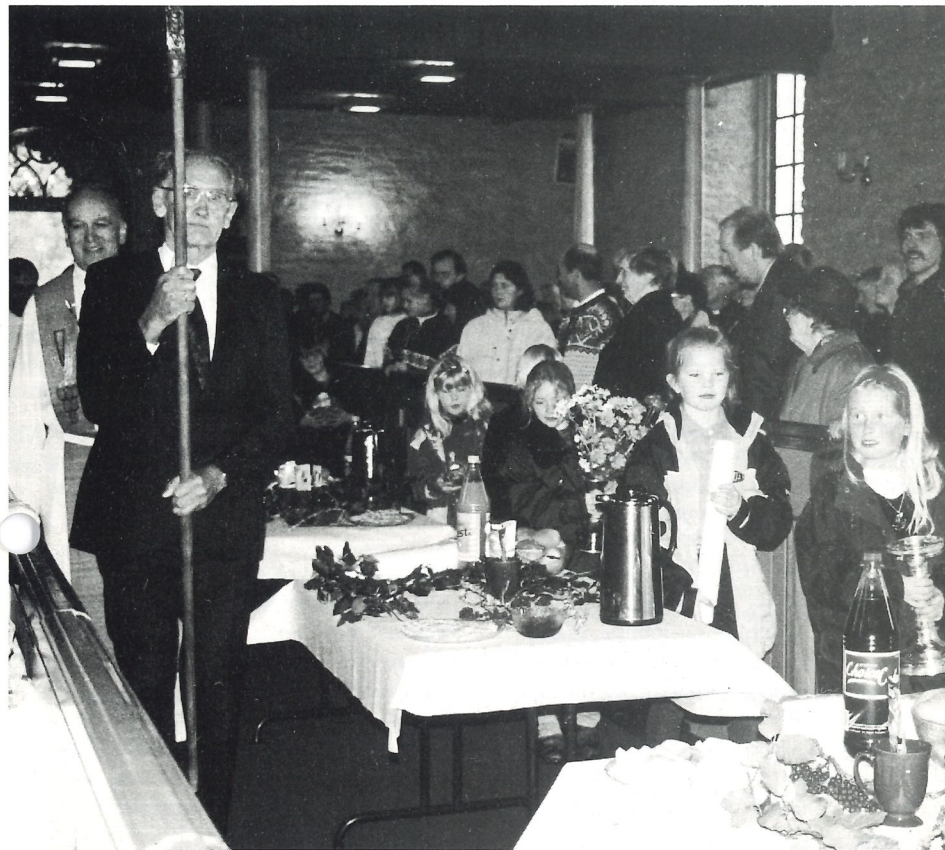
Elevar frå 3. klasse ber inn «markens grøde» under gudstenesta i Arna kyrkje 18. oktober.