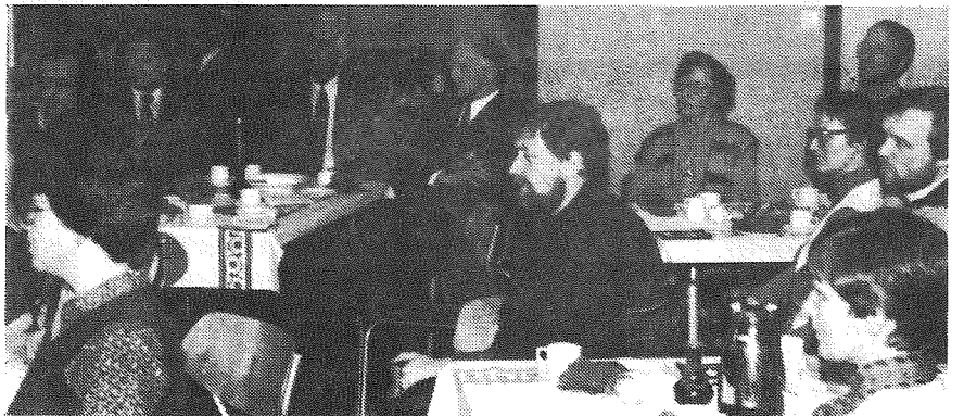
Frå møtet med sokneråda og dei tilsette i kyrkjelydane.