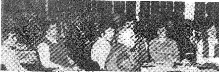
— og leiarsamling i Arna bedehus med 130 frå begge kyrkjelydane.