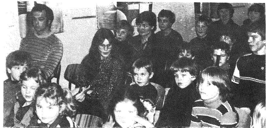
Skule- og familiegudstenester var det og — her frå gudstenesta på Tren- gereid. Elevane hadde laga teikningar og dei tok del i gudstenestene med fleire innslag.