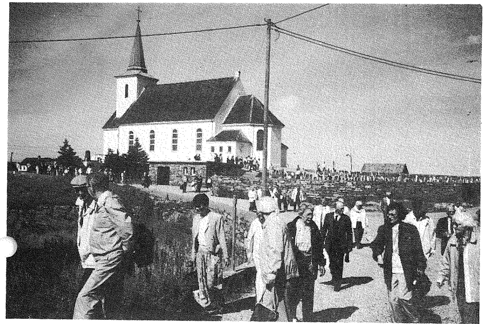
Menighetens tur gikk i solskinn og vindstille til øykommunen Fedje lengst vest mot havet

Etter gudstjenesten var det middag i be-dehuset like over veien for kirken. Olav