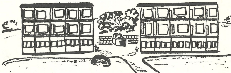
Trygdebustadane i Breisteinsli.

Pensjonæranne i Trygdebustadane i Breisteinsli skal no etter at fleire år har fått — få gleda av alle lokalitetane sine. Dørene vil og stå på vidt gap for andre eldre i Ytre Arna som vil ta turen inn.