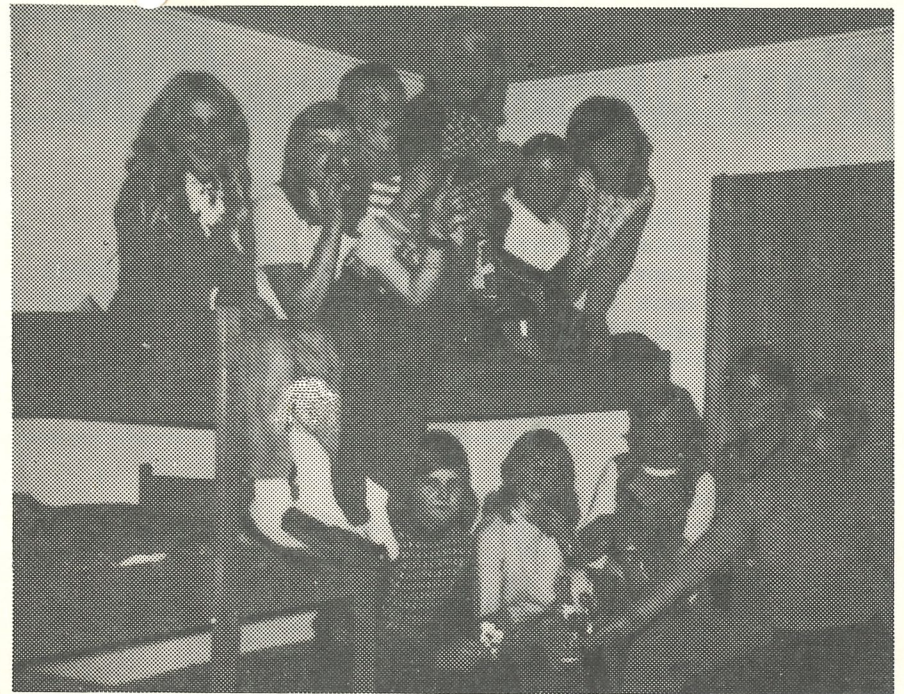
Frå eit av jenteromma.