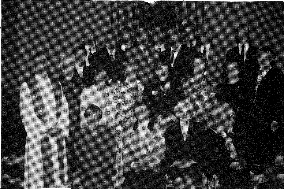
50-årskonfirmantar i Arna kyrkje 26. sept. 1993.