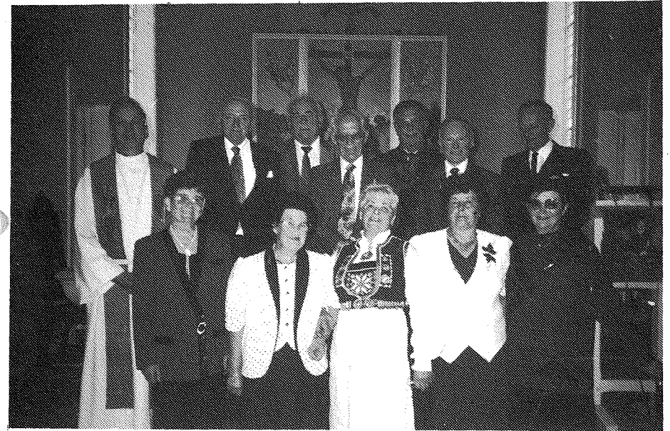
50-årskonfirmantane var samla i Ytre Arna kyrkje søndag 3. oktober.