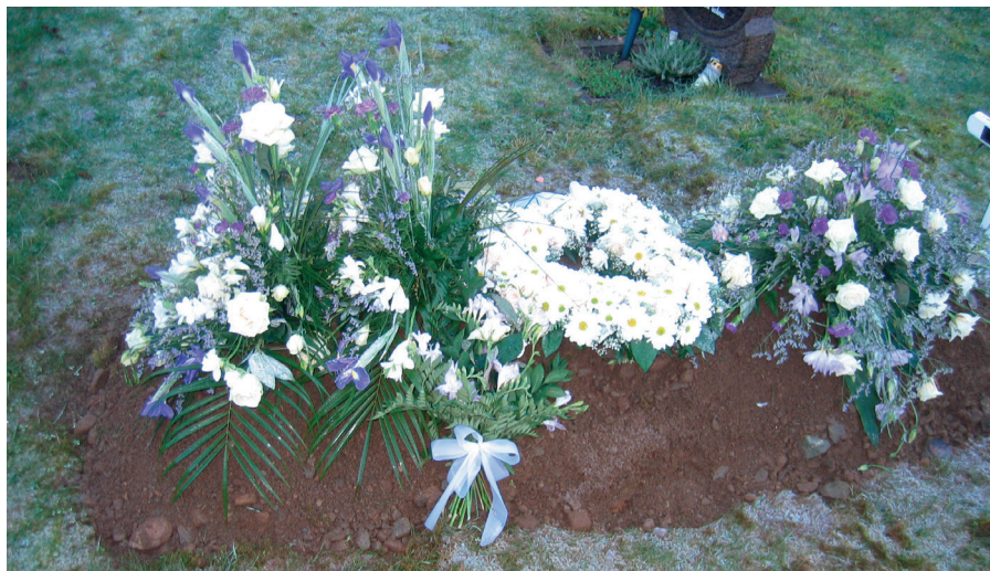
Kistegrav er den vanlegaste gravforma i Fusa. I Os er talet urnegravleggingar aukande og der er om like mange urnegravleggingar som kistegravleggingar.

I Fusa sokn har ein liten tradisjon for bisettingar og dermed urnenedsetjingar. Vi har inntrykk av at talet er litt oppadgåande, og vi vil oppmode fleire om å tenkje gjennom dette med bisetting og kremasjon.