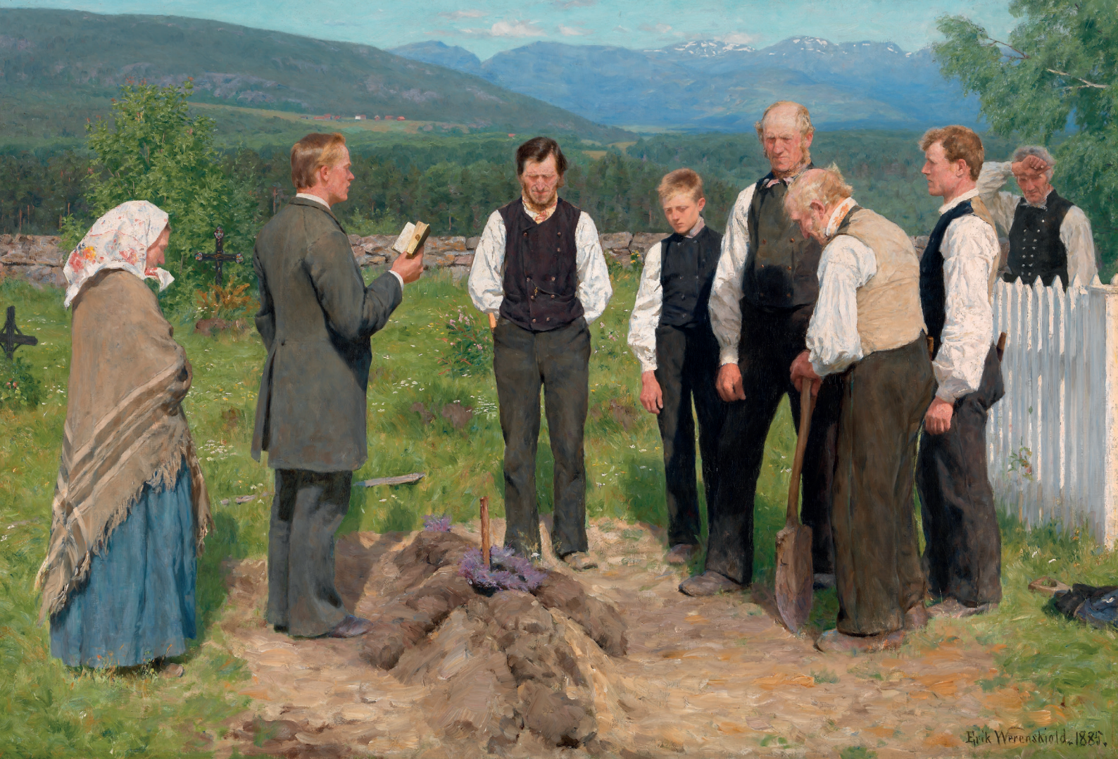
«En bondebegravelse» mala av Erik Werenskiöld, 1885. Eigar av maleri: Nasjonalgalleriet.