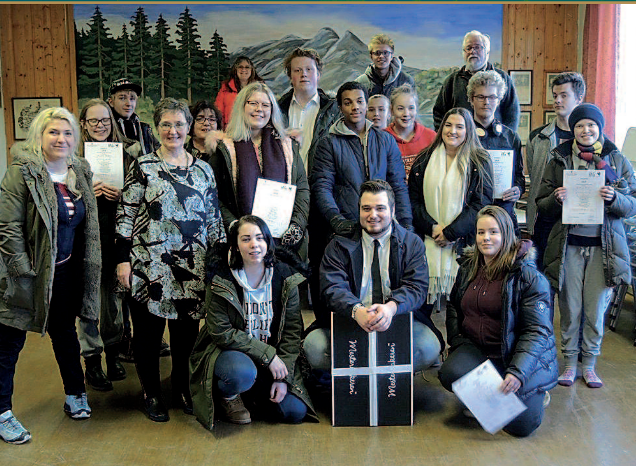
Ungdomslederkurs (ULiF) 2018