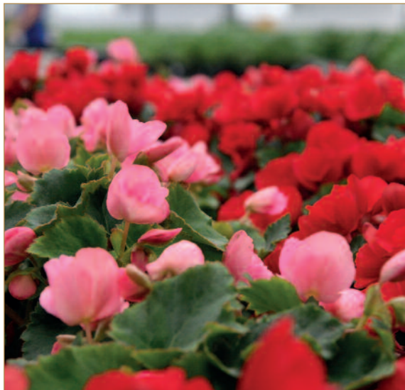
Kirkegårdsbegoniaen ble valgt fordi det er en robust og fin plante som blomstrer hele sesongen.

PLANTEDAG må tas i slutten av mai, slik at ikke frosten kommer og ødelegger plantene. Gjennom blomsterfondene blir det delt ut en plante til hver grav som dekkes av de respektive blomsterfondene som hver kirke har. I fjor hadde vi en forsøksordning på kirkegårdene med at kun en type plante ble delt ut, kirkegårdsbegonia. Kirkegårdsbegoniaen ble en basisplante som gikk igjen på de fleste gravene, og som også ble brukt til forskjønnelse på kirkegården. Kirkeutvalgene syntes dette fungerte bra, så det blir samme opplegg i år. Kirkeutvalgene serverer kaffe i kirken på plantedagene.