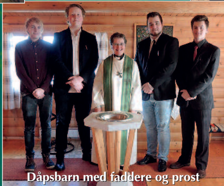
Dåpsbarn med faddere og prost