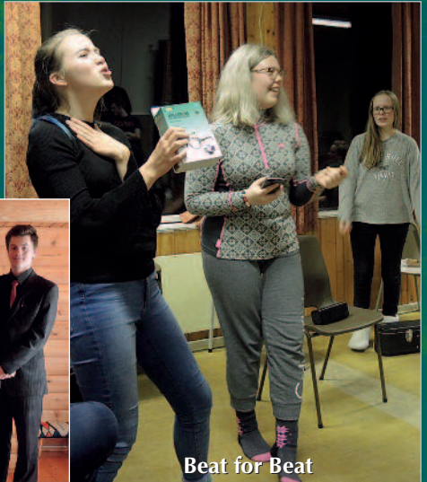
Beat for Beat