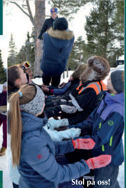
Stol på oss!