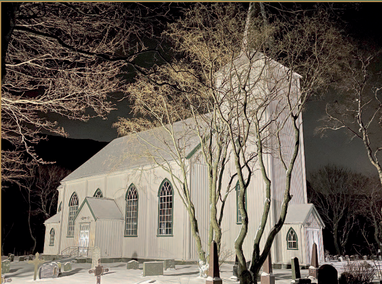
Nes kirke