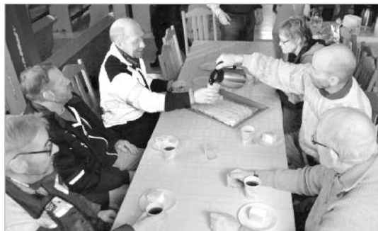
Kaffepause - Det sosiale er viktig

deler ut program osv, er med på opptelling av kollekt, setter fram kaffe/kjeks/tilsvarende, hjelper til med rydding, være litt sosial