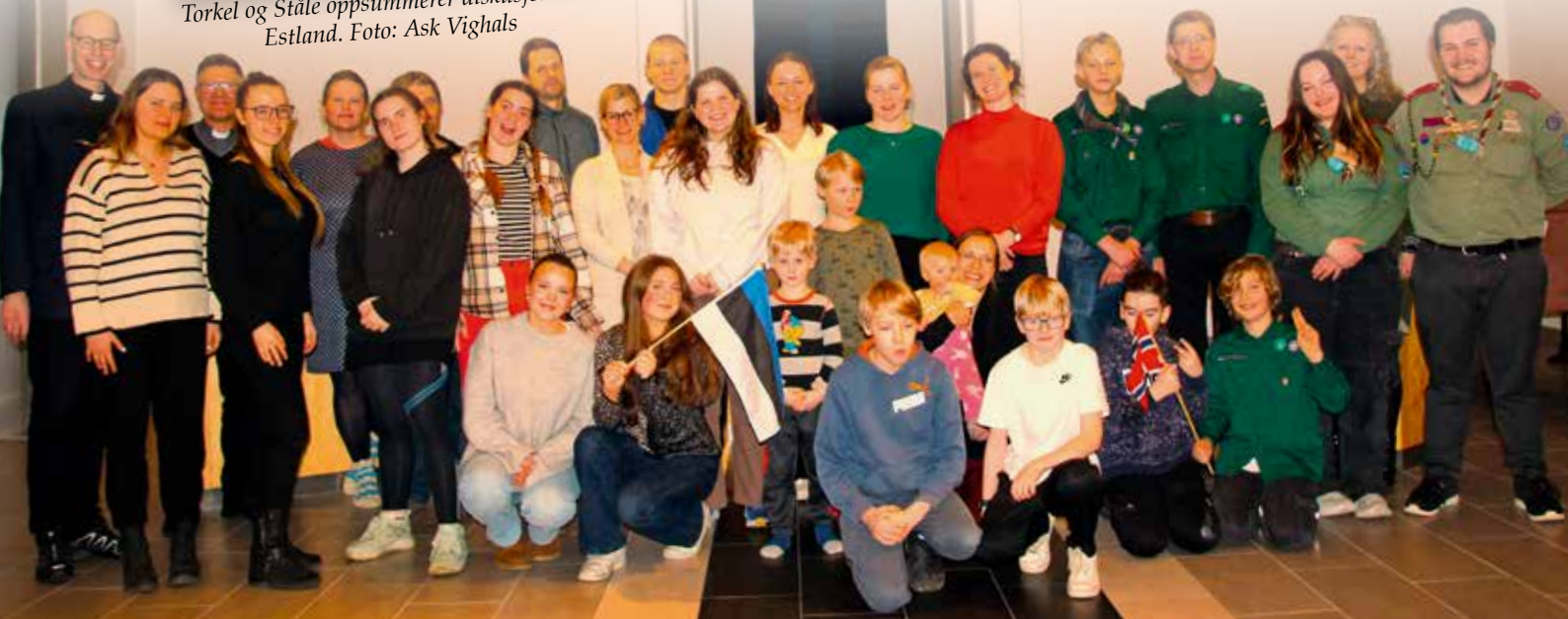
Estisk norsk kulturkveld.