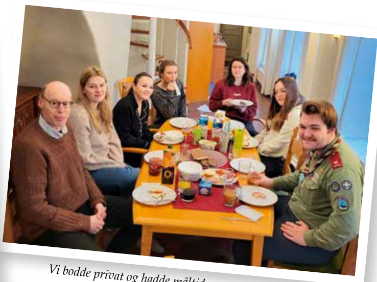
Vi bodde privat og hadde måltider og samlinger i lag.