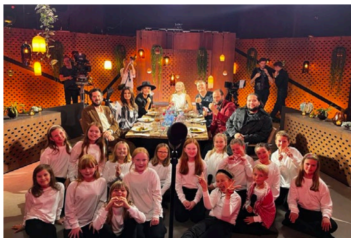
Kjerringøy barnekor sammen med sangere fra Rønvik barnekor på «Hver gang vi møtes»