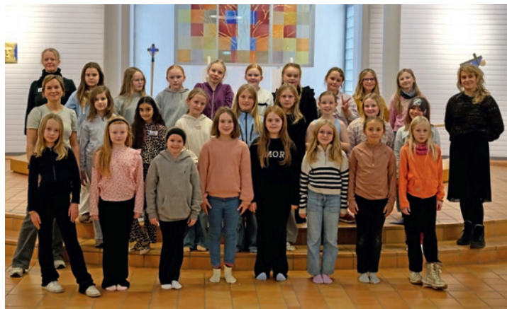
Rønvik barnekor har blitt en stor og sangglad gjeng.

Hurra for Rønvik barnekor som har blitt 1 år og takk for innsatsen til alle som er med! Vi håper koret skal feire mange bursdager og jubileer i årene som kommer.