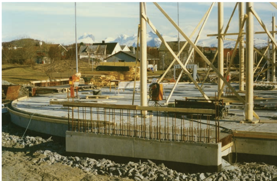
Kirken reiser seg.

Valget av tomta ved den gamle lærerskolen mener jeg å huske ble det som gav det