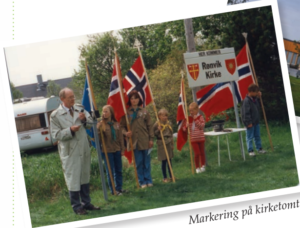
Markering på kirketomta.