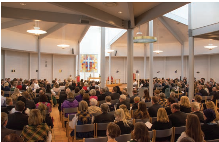
Konfirmasjon med fullsatt kirke.

Vår menighet har i mange år vært involvert i arbeidet med ny dåpsliturgi. Vi har prøvd mange ulike forslag. Nå tror vi mange er glade for at ny dåpsliturgi endelig er vedtatt.