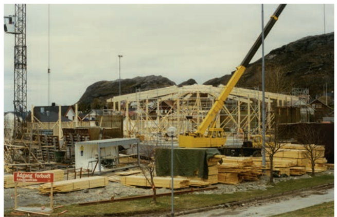
Kirken reiser seg.