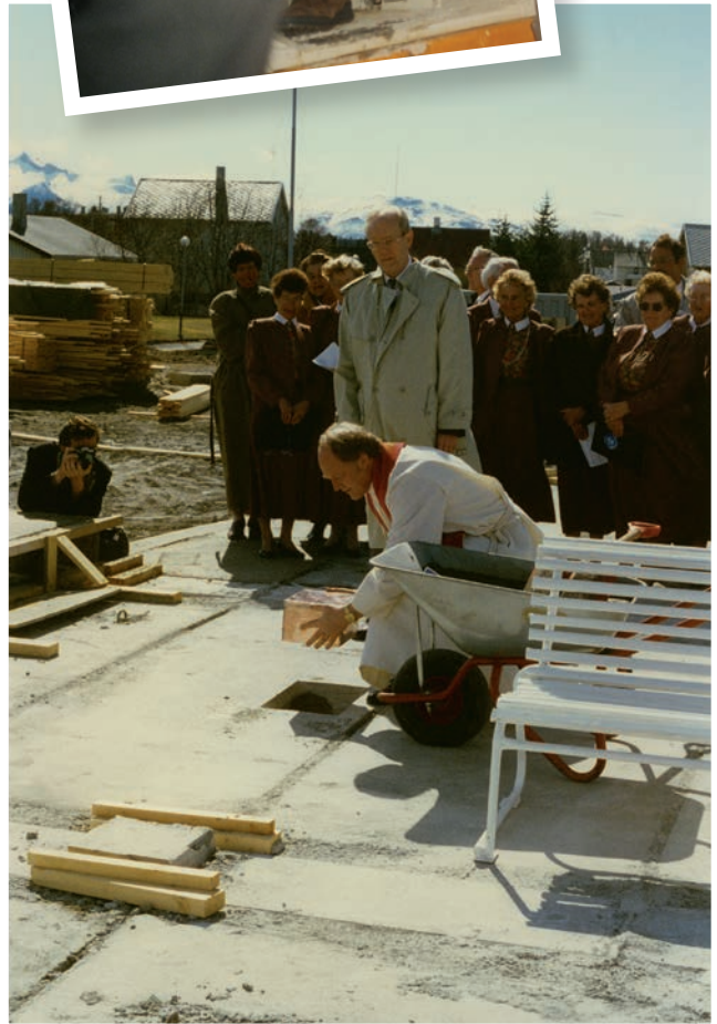
Biskop Øystein Larsen legger ned grunnsteinen