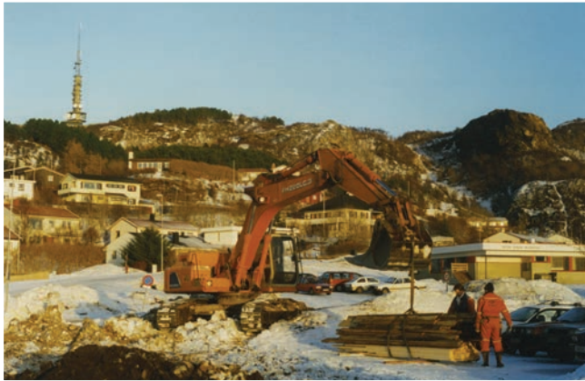
Selmer rigger seg til på Kirketomta fredag 24.1.97