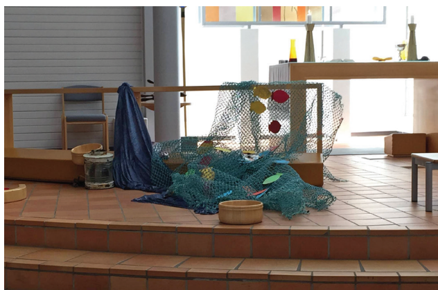
Barna deltok i preken og fikk kaste fisk i garnet.