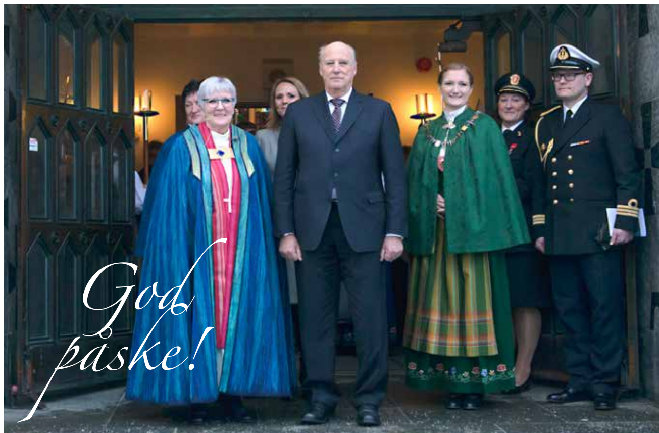
Kongelig besøk under vigslingen av vår nye biskop.