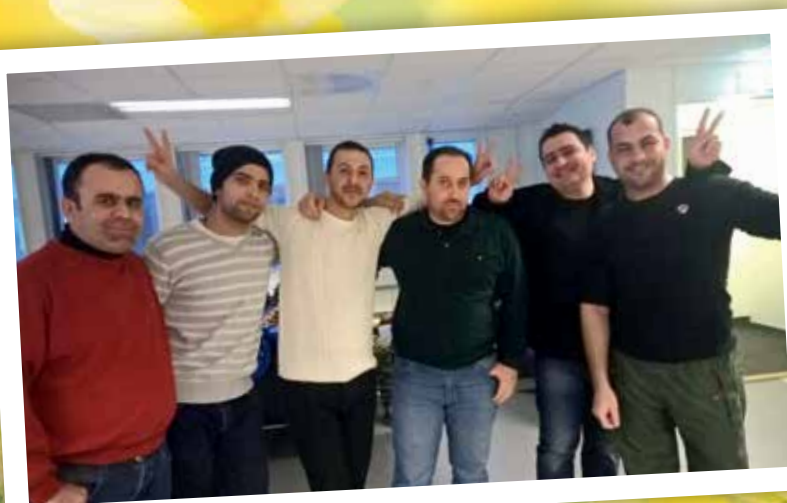
Våre venner fra Syria.