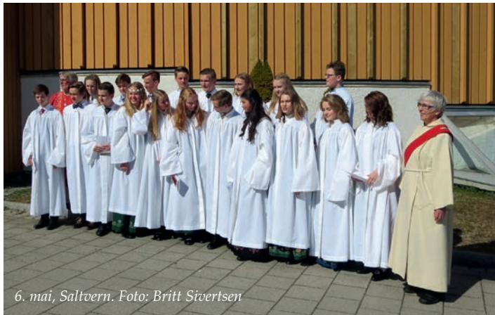
6. mai, Saltvern.