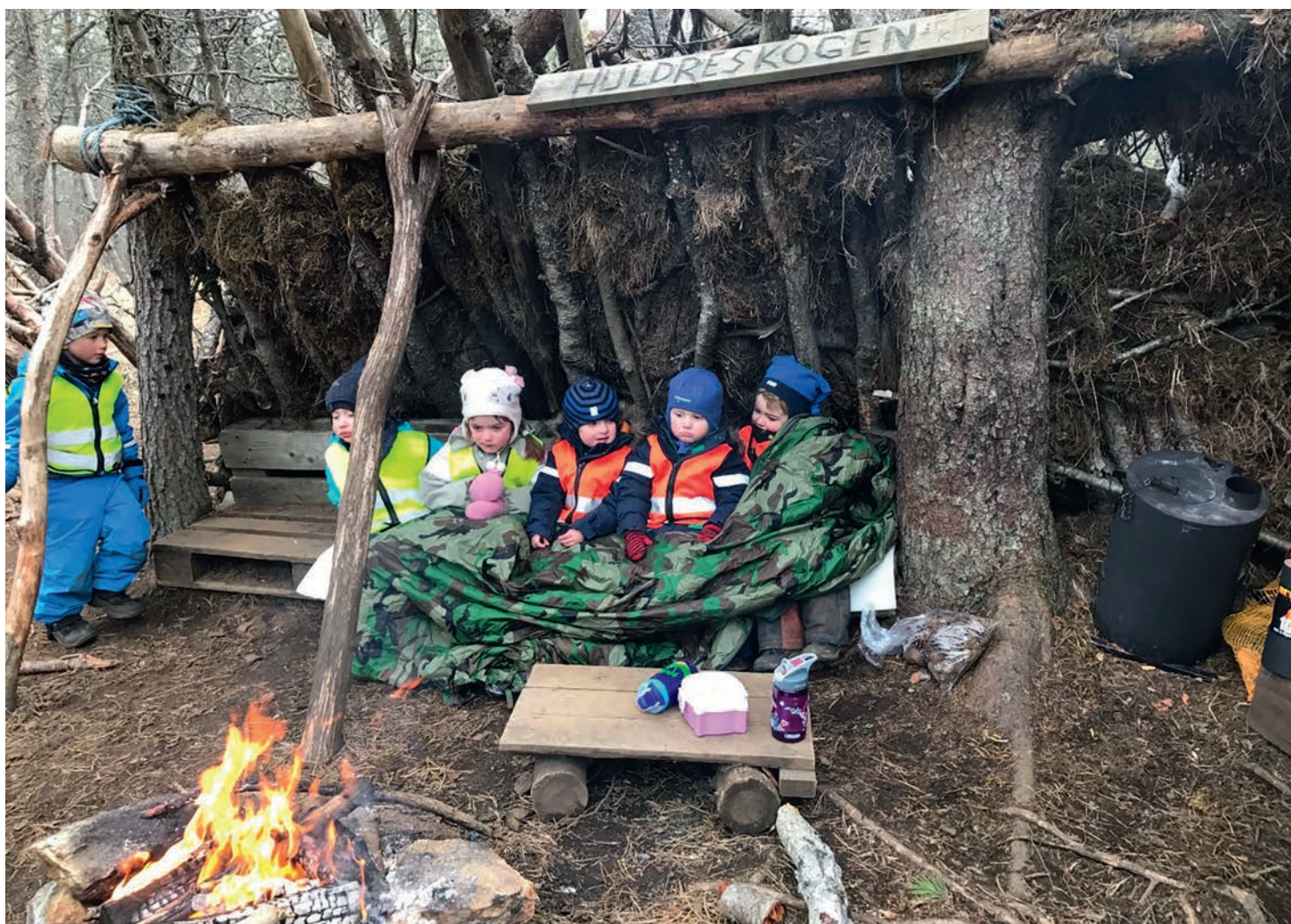
Godt med bål når det er kaldt