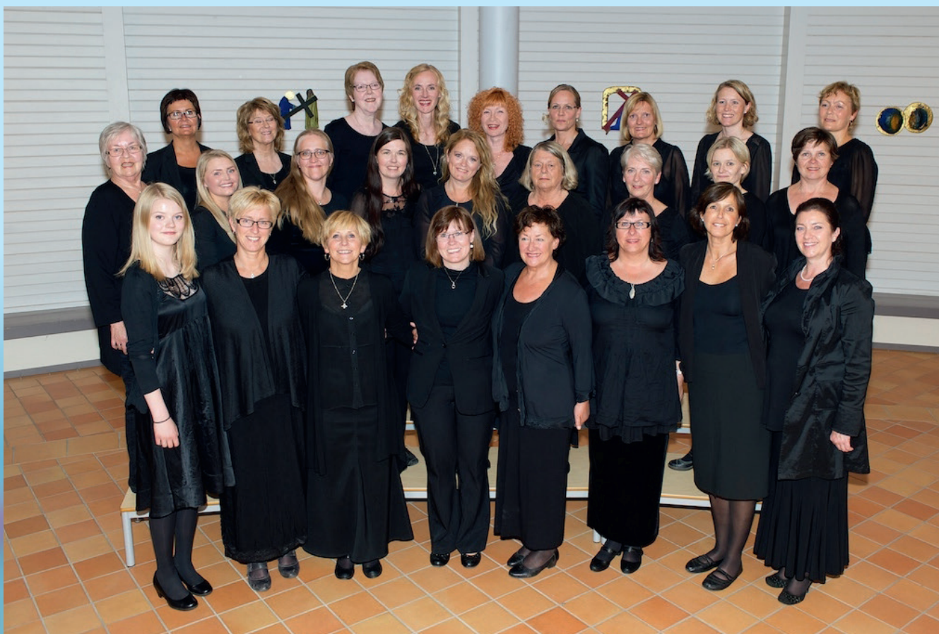
Bodø damekor desember 2014.