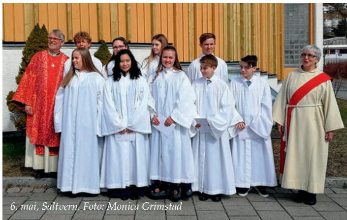
6. mai, Saltvern.

De to første helgene i mai var det 6 konfirmasjonsgudstjenester i Rønvik kirke. I år er det 99 konfirmanter - en på Kjerringøy og 98 i Rønvik kirke. Konfirmanterne er supre! Flotte ungdommer som det er svært hyggelig å være sammen med. Takk for konfirmasjonsåret!