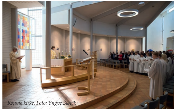
Rønvik kirke.