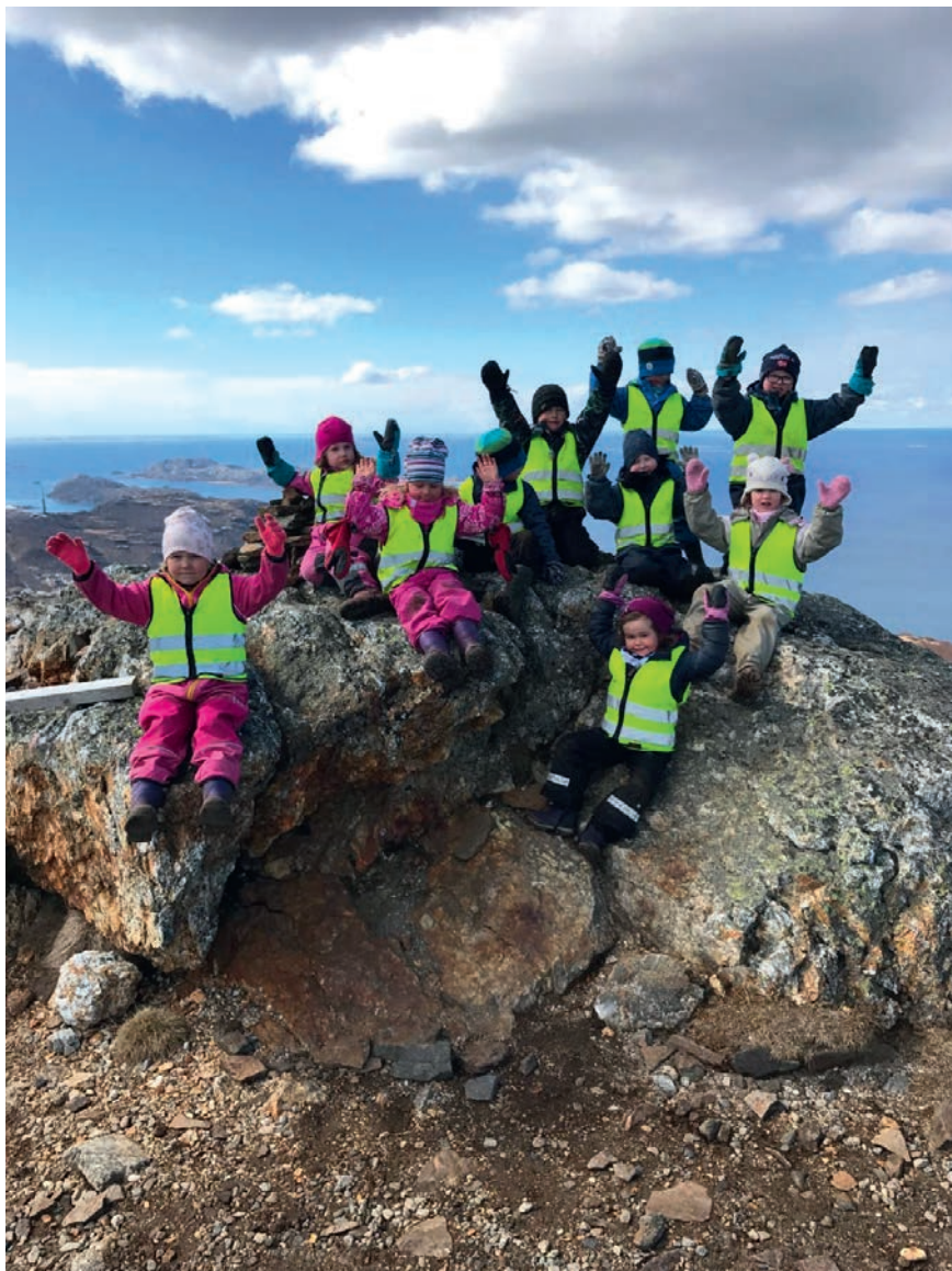
Gruppe på tur til Keiservarden

Vi ser også at barna nå kan sanger utover det tradisjonelle. Småbarnkulturen inntas av det som før var vanlig blant eldre barn. Mange barn skal ha – eller får – alt på en gang, gjerne to-hjuls sykkel når de er 2 år! Ungene og foreldrene er påvirket av reklamen og det blir lett konkurranse mellom foreldrene og mellom barna. «Mine barn skal ikke ha noe mindre enn andres barn». Vi kan også se at noen barn får for mye ansvar og for vanskelige valg i forhold til alderen. Vi prøver å ta vare på den tradisjonelle barnekulturen. Vi ønsker at den skal holdes i hevd, og vi ser at ungene har mye glede av den.