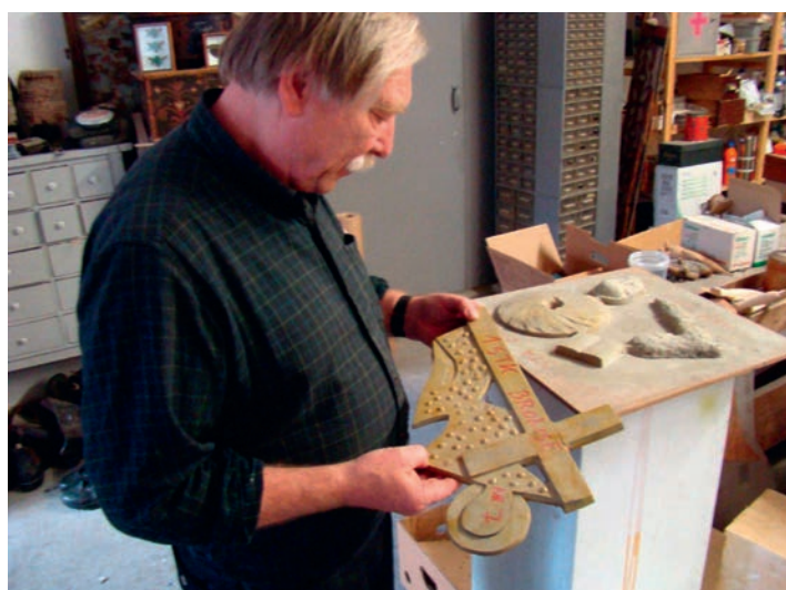
Torvund i verkstedet sitt i Telemark med modeller til noen av stasjonene på Korsveien.