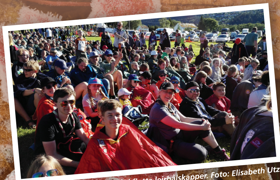
Speidere på leirbål i flotte leirbålskapper.