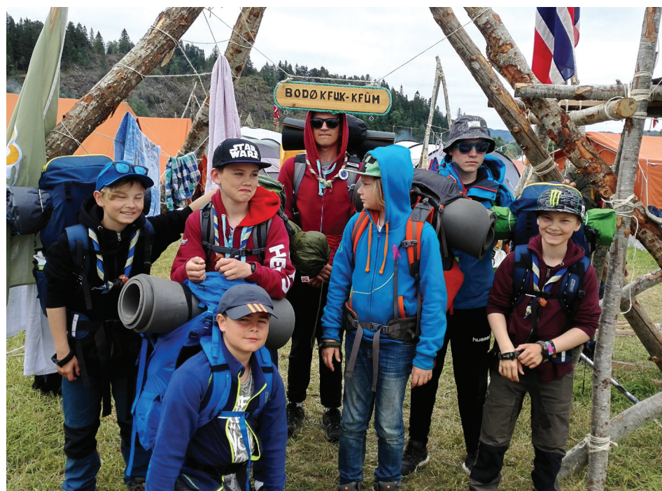
Guttene klare for haik.