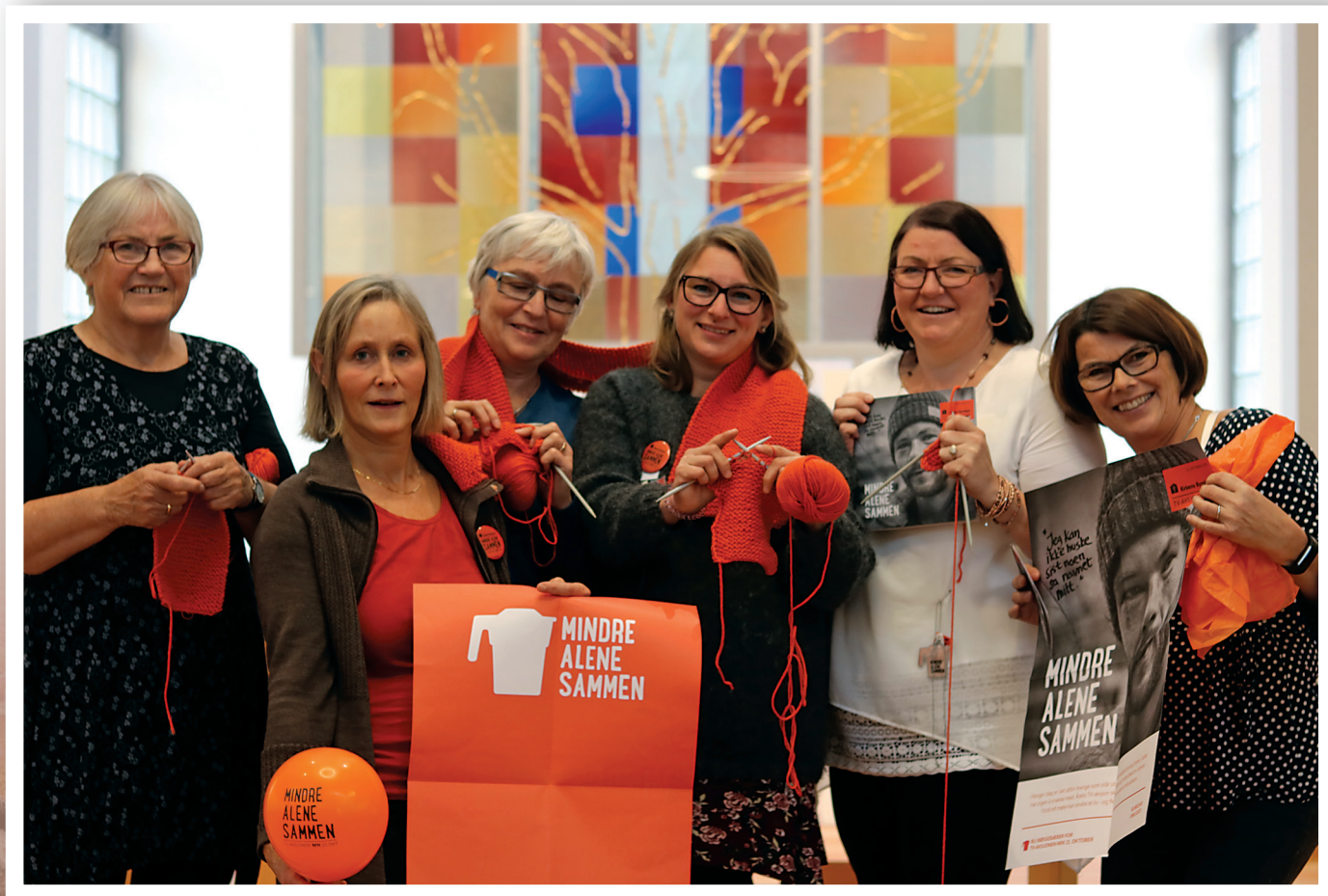
Rønvik menighets stab og frivillige strikker varme skjerf til de som trenger.