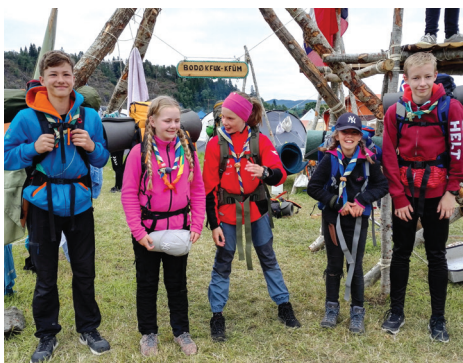
Speidere klare for haik.

Det var solbrune, trette og fornøyde barn som kom hjem med toget en uke senere.