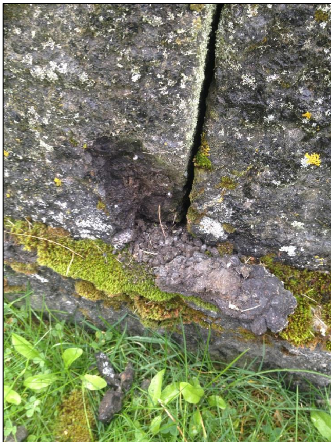
TILSTAND AV GRAVSTEIN GERHARD KRISTIANSEN FRA BAKSIDEN

På høyre side av gravsteinen mangler et stort hjørne, som kan suppleres med mørkfarget sement.