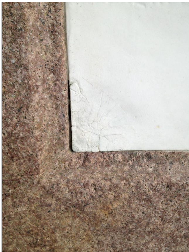
TILSTAND AV GRAVSTEIN ANNA ELISABETH ZAHL ETTER RENJØRING