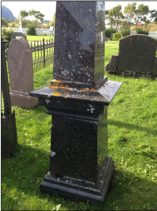
TILSTAND AV GRAVSTEIN ERASMUS ZAHL FØR RENGJØRING AV BAKSIDEN