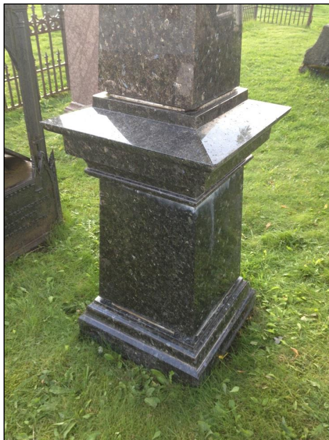
TILSTAND AV GRAVSTEIN ERASMUS ZAHL ETTER RENGJØRING AV BAKSIDEN