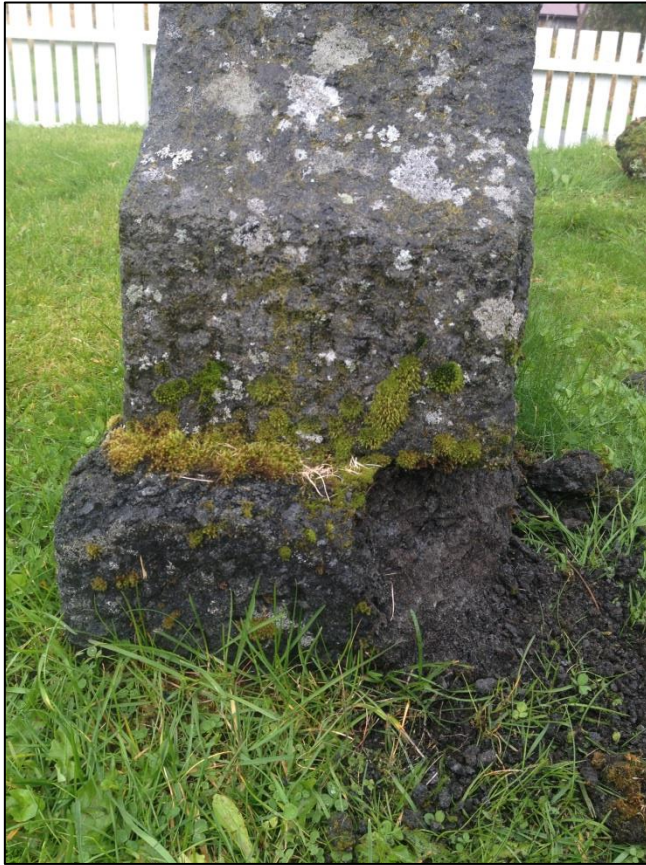
TILSTAND AV GRAVSTEIN GERHARD KRISTIANSEN FRA SIDEN

På høyre side av gravsteinen mangler et stort hjørne, som kan suppleres med mørkfarget sement.