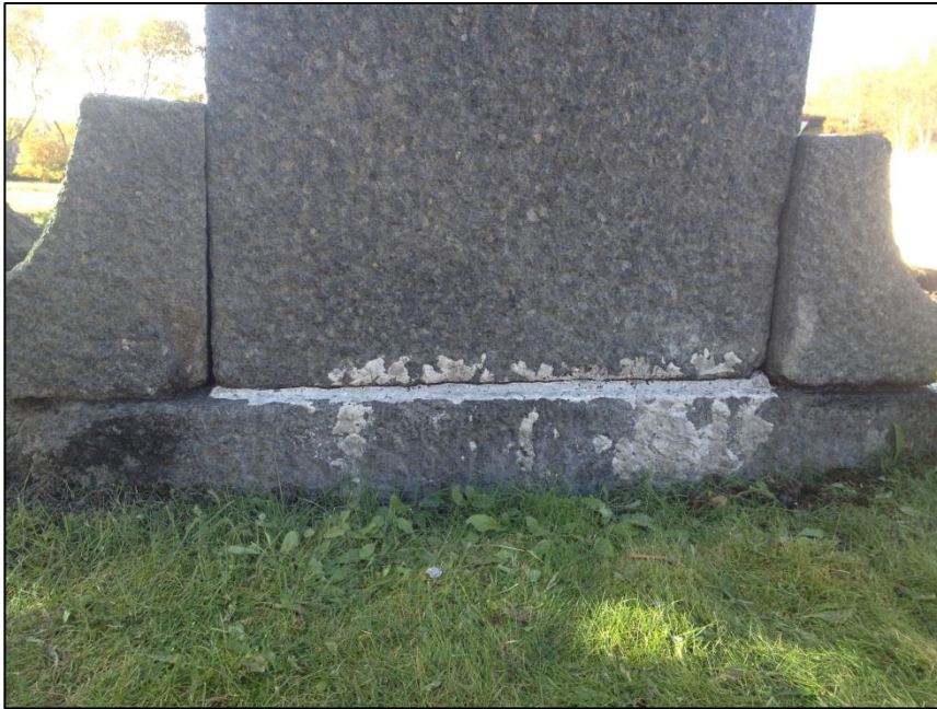
TILSTAND AV GRAVSTEIN FØR FJERNING AV NOE SEMENT PÅ BAKSIDEN