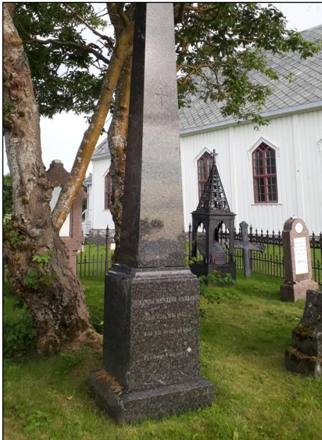
TILSTAND AV GRAVSTEIN FØR RENGJØRING