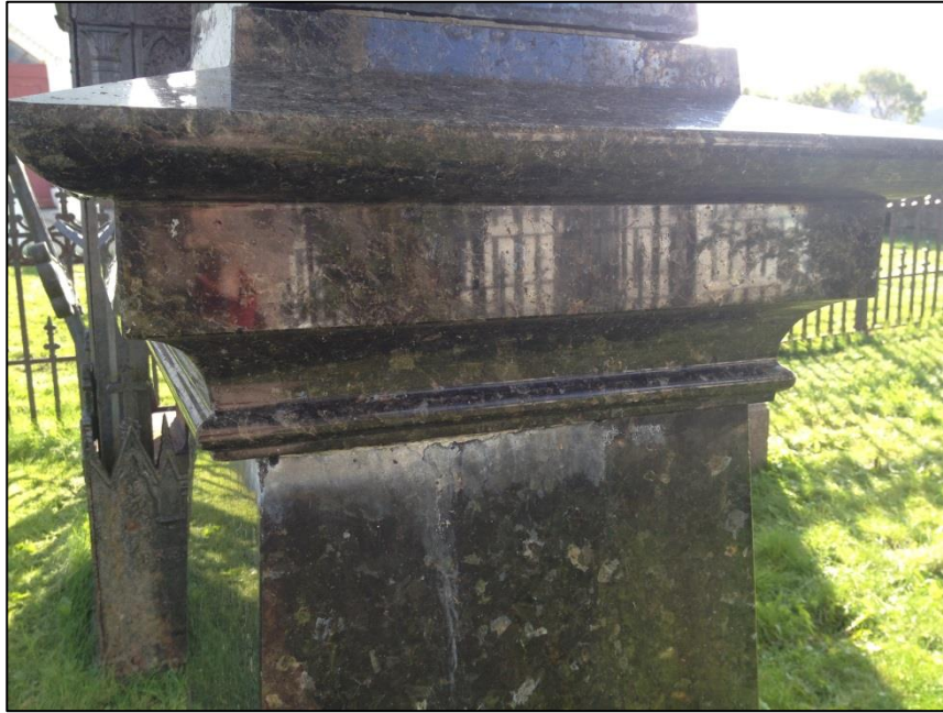
TILSTAND AV GRAVSTEIN ERASMUS ZAHL FØR FJERNING AV KALKSKORPE