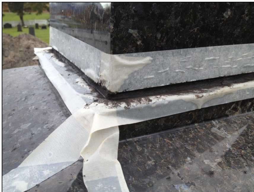
TILSTAND AV GRAVSTEIN ERASMUS ZAHL FØR OPPUSSING AV FUGEN