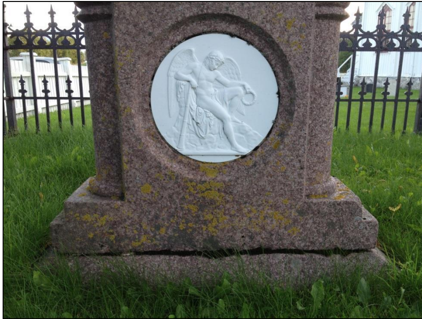
TILSTAND AV GRAVSTEIN ANNA ELISABETH ZAHL FØR RENJØRING DETAIL KERAMIK BILD