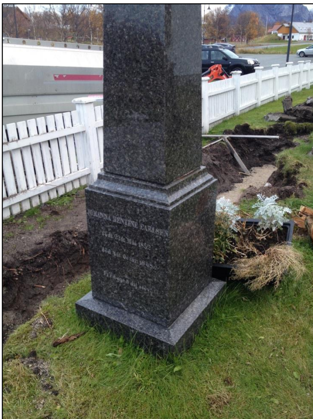
TILSTAND AV GRAVSTEIN ETTER RENGJØRING