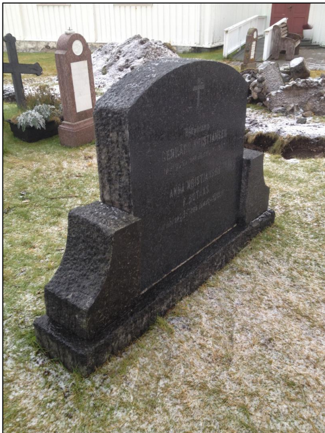
TILSTAND AV GRAVSTEIN GERHARD KRISTIANSEN ETTER RENGJØRING