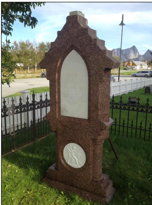
TILSTAND AV GRAVSTEIN ANNA ELISABETH ZAHL ETTER RENJØRING