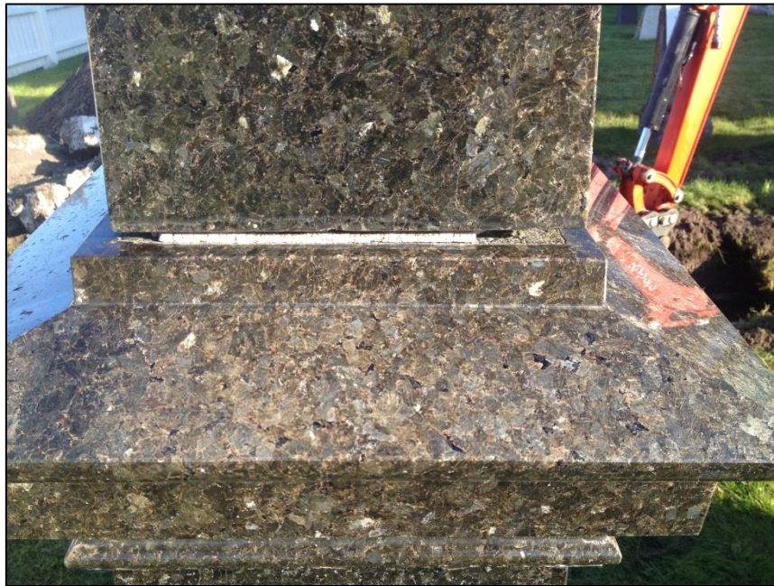
TILSTAND AV GRAVSTEIN ERASMUS ZAHL FØR OPPUSSING AV FUGEN