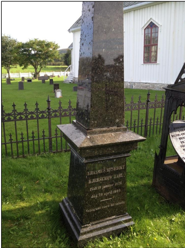
TILSTAND AV GRAVSTEIN ERASMUS ZAHL FØR RENGJØRING FRA FRONTEN