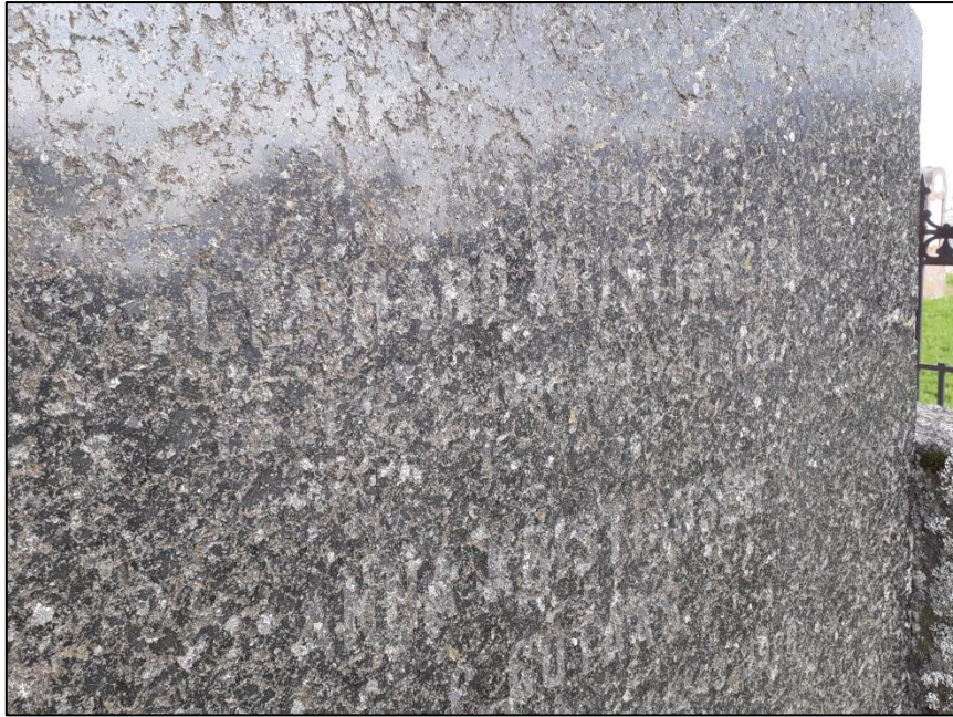
TILSTAND AV GRAVSTEIN GERHARD KRISTIANSEN FØR RETUSJERING