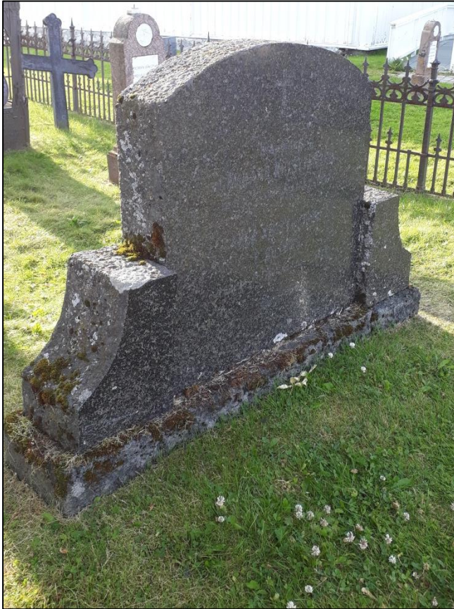
TILSTAND AV GRAVSTEIN GERHARD KRISTIANSEN FØR RENGJØRING