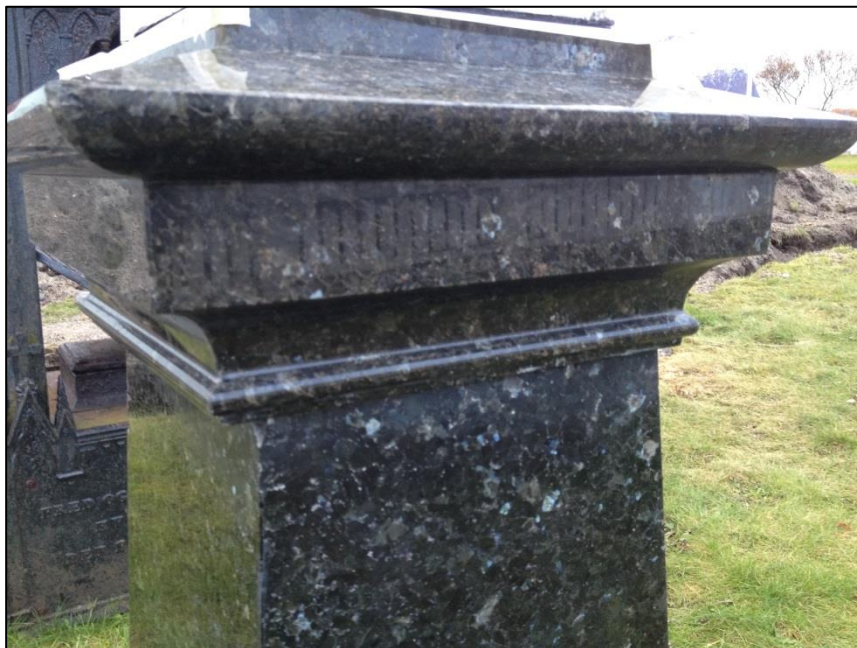
TILSTAND AV GRAVSTEIN ERASMUS ZAHL ETTER FJERNING AV KALKSKORPE