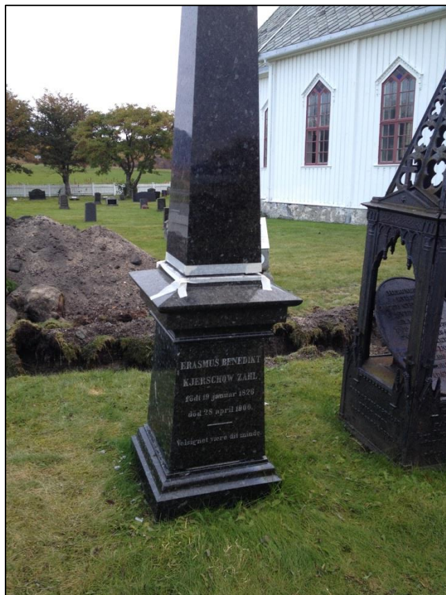
TILSTAND AV GRAVSTEIN ERASMUS ZAHL ETTER RENGJØRING AV FRONTEN