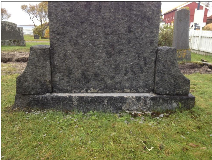
TILSTAND AV GRAVSTEIN ETTER FJERNING AV NOE SEMENT PÅ BAKSIDEN