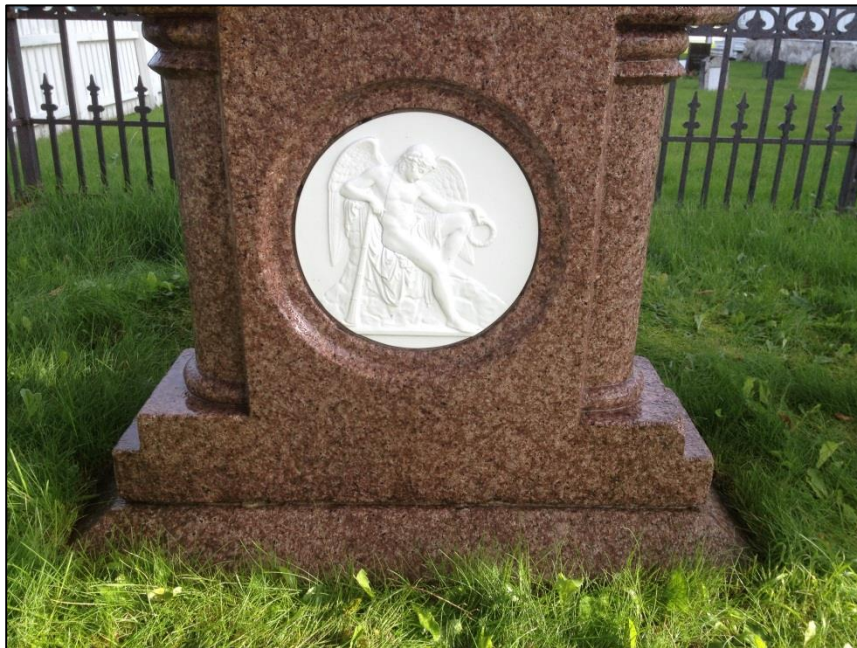
TILSTAND AV GRAVSTEIN ANNA ELISABETH ZAHL ETTER RENJØRING DETAIL KERAMIK BILD