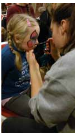
Ansiktsmalinga var populær.

Colours og CFC hadde forberedt mange ulike aktiviteter. Ansiktsmaling, neglelakk, hårfletting, flaskebowling og koppestabling, det var noe for enhver smak. Ved alle bodene betalte man med Globalpenger. Det var også et lite englekor til stede som sang for betaling. Mange barn tok utfordringa med å løpe Globalløpet: Ved å skaffe seg sponsorer samlet de inn penger ved å løpe så mange runder de kunne klare i en løype rundt kirka. De