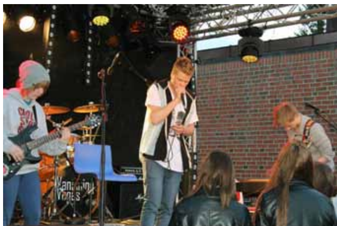
Fra utekonserten på CC 16 mai 2013.

16. mai markerer Church Chill sitt 10 års jubileum! Det er planlagt utekonsert i kirkeparken, ung messe, kafé og aktiviteter av ulikt slag! Vi starter opp utpå ettermiddagen og har åpent til 24.00. Det blir jubileumskake! Nærmere info kommer etter hvert. Velkommen!