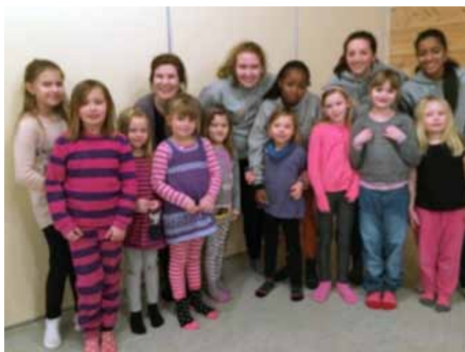
Saltstraumen barnegospel med besøk fra CFC.