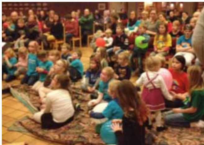
Fellesprogram i kirka.

minste barna gikk i lag med foreldrene. Her var det til og med 2-åringer som deltok! Noen tok også kjelken med på turen. En heiagjeng sto i målområdet og motiverte til mange runder. Bodø KFUK-KFUM hadde kafe i menighetssalen og her kunne man både kjøpe middag og kake. Det var full aktivitet de timene arrangementet varte, og mange var ennå ikke ferdig da vi skulle avrunde.