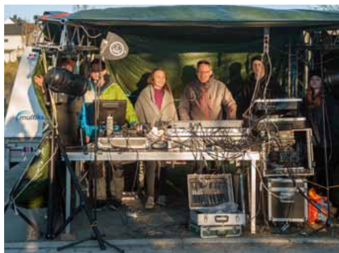
Lyd og lys.