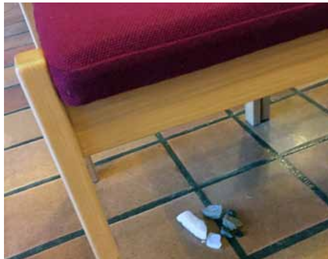
Steinene i Tverlandet kirke.

Det får meg til å tenke at kristentroen ikke gjør oss til mer enn helt vanlige mennesker. Kristentrua ligger ikke i oss selv når vi tror. Kristentrua ligger i den vi retter vår tro imot. Billedlig talt: Vi er som blomsten på marken. Ingen av blomstene eier sola mer enn de andre. De er alle avhengige av «den varme og det livsmot» som solstrålene rekker når de folder seg ut mot sola. Slik tror jeg alle mennesker er like og lever under de samme kår – i seg selv – uavhengig av hva vi tror på.