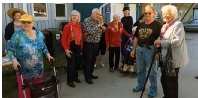
En spent flokk stiller til start.

Det var en liten gjeng som spente stilte til start. De gikk i flokk og følge på oversiden av bo- og servicebygget. Etter et lite stykke var det en stasjon med saft og noen spørsmål. Flere var ivrige til å svare og det var godt med noe å drikke. Vi endte opp i Rosehagen hvor to frivillige hadde ordnet pølse med brød og is. Praten gikk livlig etter løpet og folket koste seg i det nydelig været!