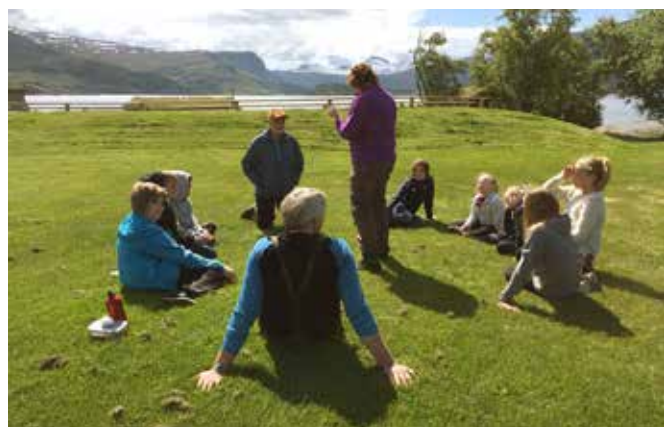
Fra undervisningen på lørdag.

Misvær + ansatte og frivillige fra miljøutvalget i vår menighet som ledere. Det ble satt opp leirplass i sola med to lavvoer, vi ble kjent med hverandre gjennom lek og aktiviteter: fiske fra båt og land, bading og forming ute. I løpet av kvelden ble bibelfortellingen om Jesus som møtte fiskerne og kalte dem, lest og innøvd til drama, det ble gode måltider, leirbål og stemning før soveposene ble inntatt.