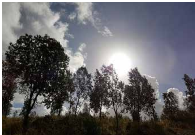
«Jeg er verdens lys. Den som følger meg, skal ikke vandre i mørket, men ha livets lys.» (Joh. 8,12).

Hvordan virkeliggjør vi Jesu bønn i vår tid? At – tenkt tilfelle – to av aktive i Saltstraumen menighet kommer til forskjellig konklusjon i det begge regner som et viktig spørsmål og begge baserer sin overbevisning begrunnet i Bibelen som Guds ord. Kan de to fortsatt