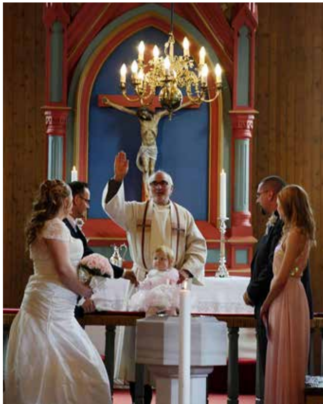
Fra vielse i Saltstraumen kirke 20.august.