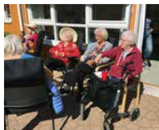
Deilig med mat og sol etter løpet.