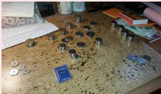
Å være med på å telle opp kollekten i kirken er like spennende hver gang. Mye rart å finne i kollektbassa, denne gangen er vi sikret salt i grøten.