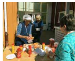
To frivillige stilte opp med pølse og brød.