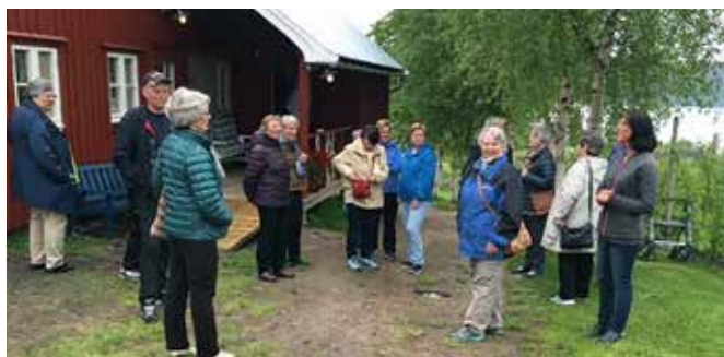
Utenfor låven på Bjørklund gård.