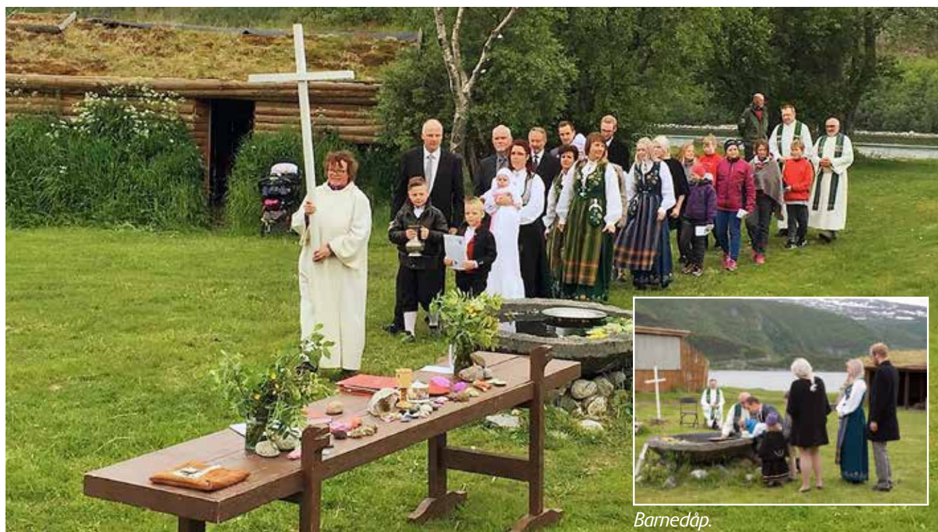
Prosesjon til gudstjenesten.

Søndag var det litt mer grått og kaldt i været, men det ble friluftsgudstjeneste med dåp av to barn (en fra hver menighet) og kirkekaffe rundt bålet. Det ble to flotte dager! Vi takker for samarbeidet og ser fram til å møtes i Saltstraumen i juni 2017!