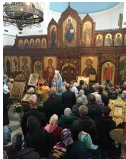
Gudstjeneste i den russisk ortodokse kirke.