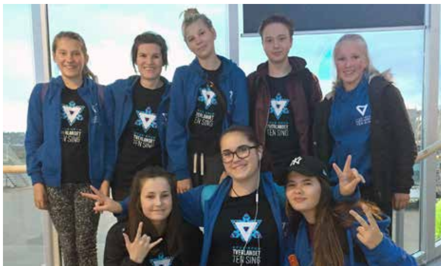
En fornøyd gjeng som snart er hjemme.

Turen gikk fra Murmansk til Kola by, Montsjegosk, Kandalaksja, Apatity og tilbake til Murmansk igjen. Vi viser noen glimt fra turen.