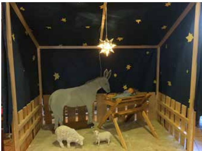
Stall – Tverlandet kirke.

Kort tid etter fødselen måtte Maria og Josef ta barnet med å flykte til Egypt. Herodes ville drepe barnet. Historien rommer flukt og terror, redsel og hjemløshet. Englene sang om en stor glede, en glede for hele folket. Her var det ingen forskjell, dette barnet skulle betyr noe for alle, gi noe til alle. Fortellingen rommer alle typer mennesker.