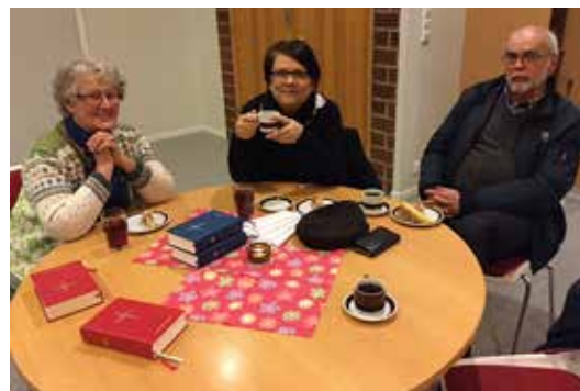
Godt med kake og kaffe.

Vi leverer alt i byggevarer. Velkommen til oss!