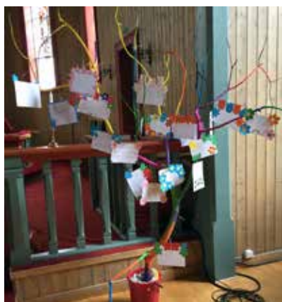
Ønsketre laget av 3. og 4. trinn på Saltstraumen skole til skolegudstjenesten 9. Juni»

Håpet får gripe det kommende daggy Englenes lovsang skal sprengre vårt mørke. Se, her blant mennesker finnes Guds bolig! Ingen er lenger alene på jorden.