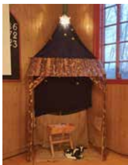
Stall – Saltstraumen kirke.

Men den som jeg velger å ta med denne gangen er vår egen salme, Mitt hjerte alltid vanker. Hans Brorson, 1694 – 1764, er en av våre store danske salmediktere. Denne flotte julesalmen er et av hans store dikt, og tar oss med inn i undringen over julens budskap, Jesus ble født i en stall, i meget