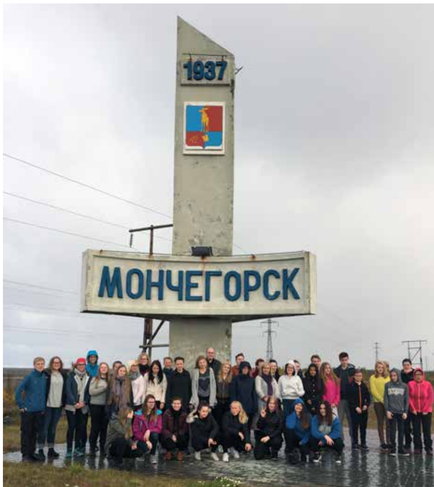
Alle festivaldeltagerne utenfor Montsjegosk.

I løpet av våre 6 dager i Russland fikk vi oppleve en hel del. Vi fikk blant annet nye venner, vi ble kjent med den russisk-ortodokse kirke, vi fikk smake ny mat, vi fikk syngemasse, vi fikk se mange nye steder og vi lærte om russisk kultur.