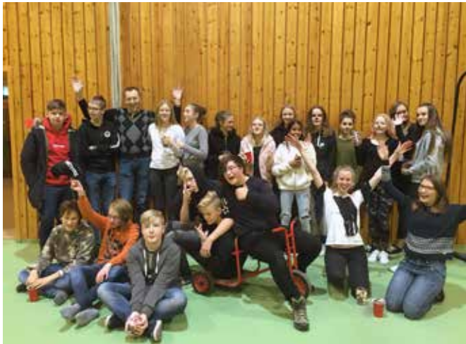
Konfirmantene etter HalloVenn.

For fjerde gang arrangerte Saltstraumen menighet HalloVenn i Tverlandshallen med et mylder av aktiviteter, godteri, store og små utklede, og ikke mins VENNER. I år var det flere aktiviteter, og kaféen flyttet fra kantina til tribuna. Konfirmantene, ansatte, folk fra menighets-