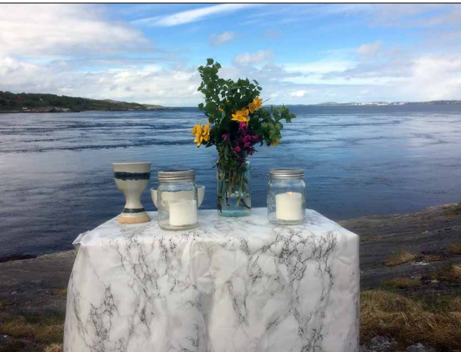
Fra friluftsgudtjeneste ved Saltstraumen 26. mai.