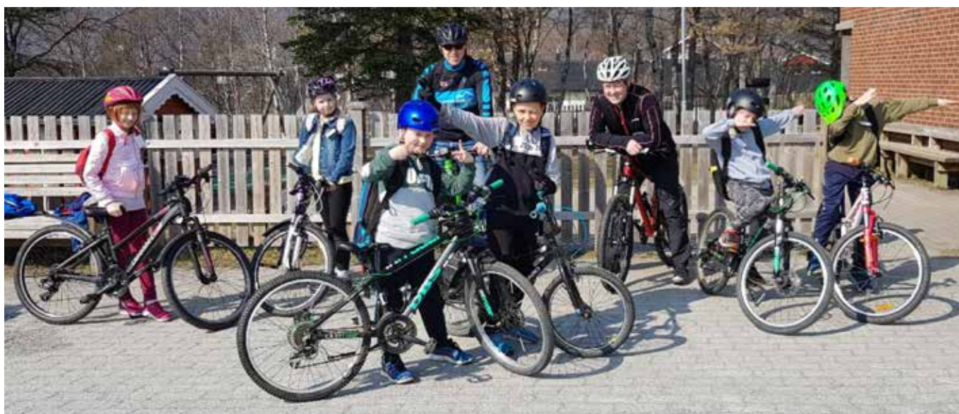
Klar for å dra på sykkeltur.

Neste år blir det på nytt en vårpuss-dag, og nye 3-klasinger ønskes velkommen til å delta!