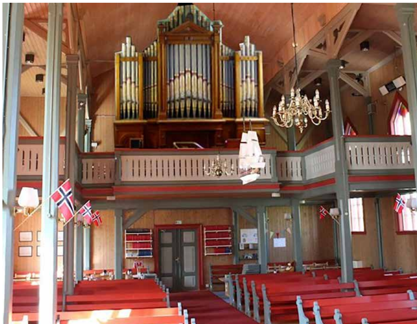
Slik omtrent vil det se ut når orgelet er på plass. Fotomontasje laget av Feenstra.

Så nå er det endelig Saltstraumen sin tur. Det er ikke et hvilket som helst orgel. Det er et brukt instrument fra 1884. Det har stått i Skottland, nærmere bestemt en kirke i Dundee. Denne kirken ble revet i forbindelse med sammenslåing av flere menigheter. Orgelet ble tatt vare på og ligger forsvarlig nedpakket i påvente av restaurering og en ny kirke å klinge i. Orgelet er bygget av et anerkjent engelsk firma, Forster & Andrews, som bygde nesten 1000 orgler, ikke bare i England, men også i Australia og Sør-Afrika. Orgelet er på 25 stemmer og blir et viktig bidrag til orgelparken i Bodø kommune.