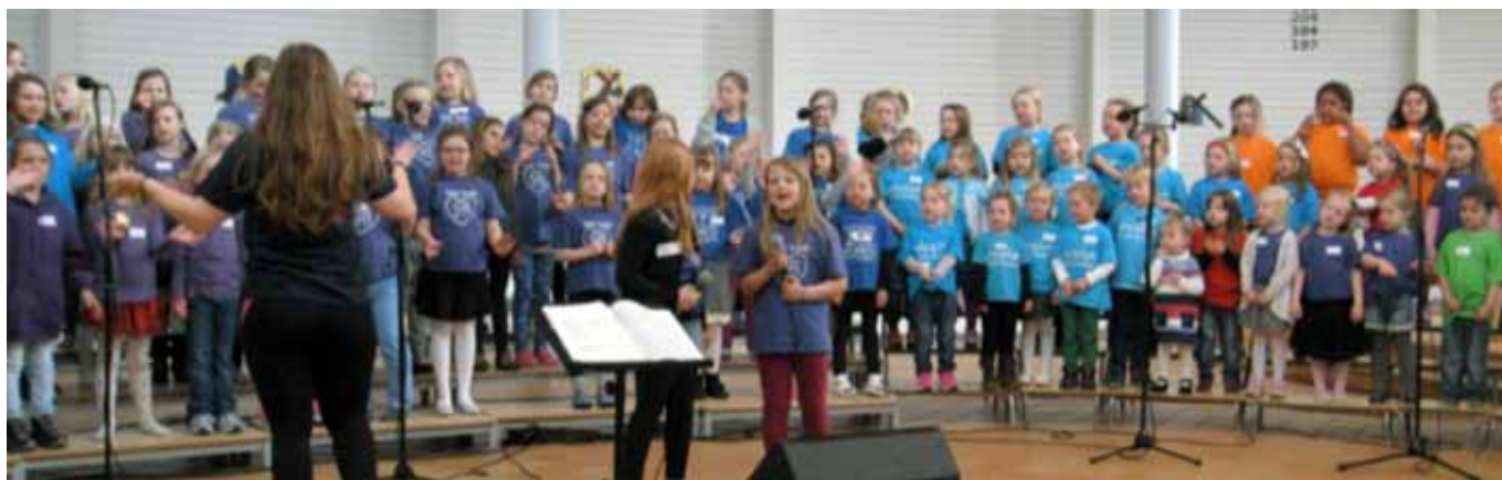
Felleskoret på Barnegospelfestivalen