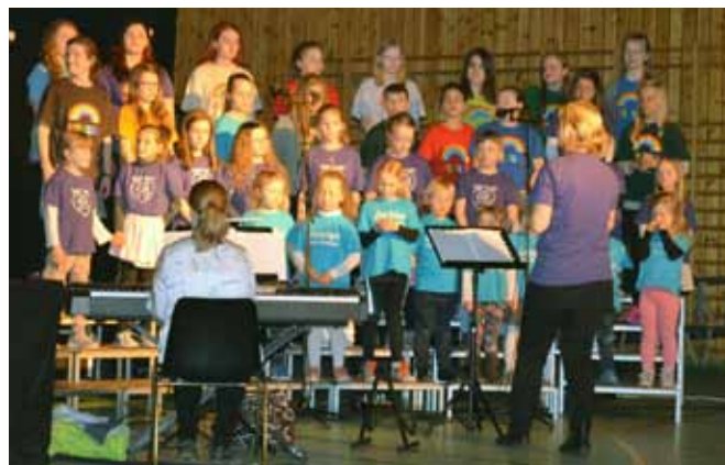
Barnegospel og Tutti Frutti med vakker sang.