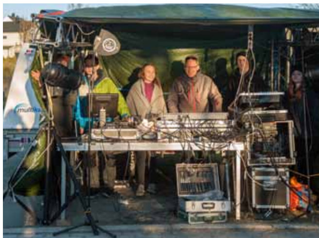
Lyd og lys.