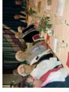
Snart klar for kake.

Nærmere info om påmelding, skyss, pris og program kommer i løpet av de siste ukene i august.