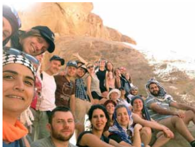
Her er hele gjengen samlet i Jordan.

-Gikk dere rett inn i konfliktspørsmålene?