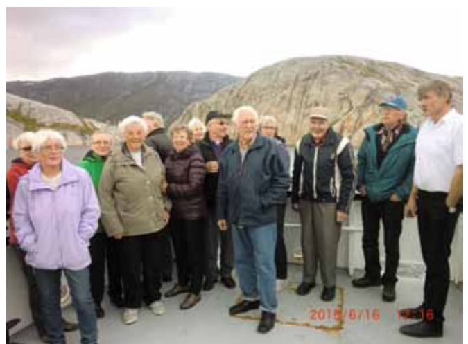
Gjengen samlet på båten.